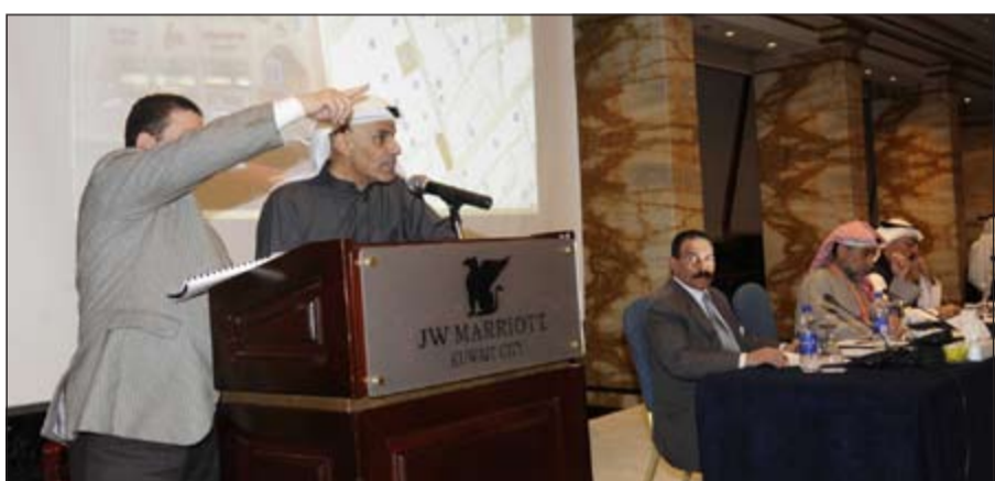
جانب من عملية بيع احد العقارات

القائمين على المزاد لاستكمال اليوم التالي. وبيع تلك المحفظة يعادل نحو 4% من معدل التداول العقاري الذي تم في الكويت خلال عام 2013 والذي بلغ حينها نحو 4 مليارات دينار، وتبلغ حصة مساهمة «بيتك» في العقارات محل المزاد ما يقرب من 31%. ومن المتوقع أن يحقق «بيتك» أرباحا إيجابية من هذا التخارج، حيث أن غالبية هذه العقارات قديمة تم شراؤها بأسعار منخفضة، فضلا عن أنها مدررة وحقق منها عوائد جيدة طيلة السنوات الماضية.