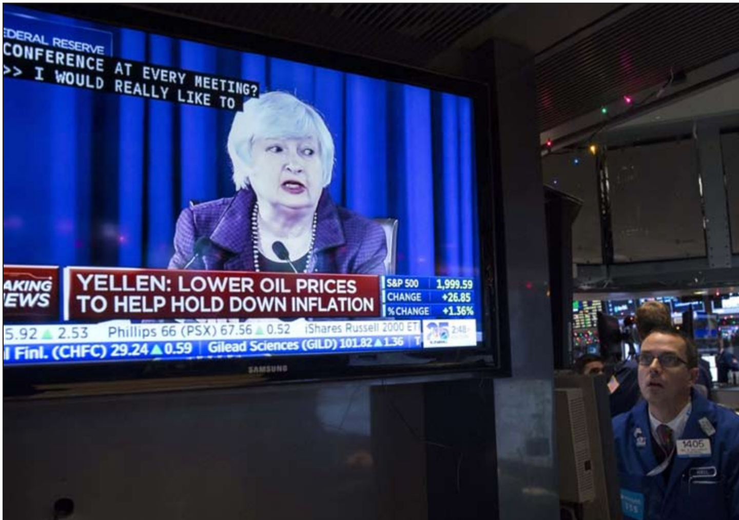
متعاملون في البورصة الأميركية يتابعون كلمة رئيس الاحتياطي الاتحادي جانيت يلين خلال المؤتمر الصحفي عبر شاشات التلفزيون أمس الأول والتي اعطت إشارة قوية إلى أن الاقتصاد الأميركي على الطريق الصحيح وان اسعار الفائدة ستبقى صفرية لأمد طويل (روبيرت)

آخر أخبار الاقتصاد المحلية والعالمية زوروا موقعنا على www.alanba.com.kw/Business