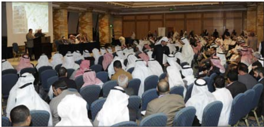
حضور كبير خلال المزاد

أعلنت الشركة الكويتية لبناء المعامل والمقاولات (معامل) أنها وقعت عقد مناقصة مع وزارة الأشغال العامة بمبلغ إجمالي 1,4 مليون دينار. ونكرت الشركة أنه من المتوقع أن يحقق العقد المشار إليه نسبة هامش ربح قدرها 2,5% من قيمة المشروع وستنعكس على البيانات المالية للشركة لثلاثة أعوام مالية ابتداء من السنة المالية 2015 وحتى نهاية السنة المالية 2017، مع ملاحظة أن نسبة هامش الربح المذكورة هي نسبة تقديرية وغير ثابتة وتتغير صعودا وهبوطا على ضوء مراحل سير المشروع ومدى التنفيذ ونسب الإنجاز ومدى تحقيق النتائج الفعلية بعد التنفيذ الكامل للمشروع.