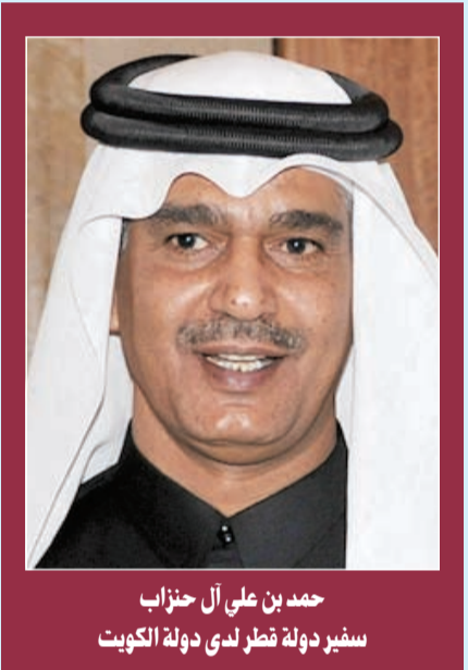
حمد بن علي آل حنزاب سفير دولة قطر لدى دولة الكويت

مجيئها وتمارس فيها شتى ضروب الرياضة الجالية منها والنسوية وكانت دولة قطر قد بذلت جهودا جبارة بترؤسها للاتحاد الآسيوي لكرة القدم لعدة سنونات حيث ساهمت في تطوير الرياضة الآسيوية واكتسبت دولة قطر خبرات واسعة ولها بنية تحتية متقدمة مكنتها من استضافة دورة الاسباد والتي اظهرت فيها امكانيات ضخمة شجعت الدولة على التقدم بثقة لاستضافة كأس العالم لكرة القدم 2022 وتكثفت مساعيها بالنجاح رغم المنافسة الشرسة مع دول لها باع طويل في هذا المضمار، ولعل احتفالنا هذا العام يجيء وقد خاب مسعى الذين حركتهم الاهواء لعدة سنوات حيث ظلوا يطعنون في احقية دولة قطر في استضافة كأس العالم الى ان ظهر الحق وزهق الباطل باعلان الاتحاد الدولي لكرة القدم (فيفا) الشهر الماضي عن براءة دولة قطر من اي شبهات فساد تتعلق بغزوها وبذلك اسكت الاصوات المنادية وقد سعدنا كثيرا استيثار وسعادة اصداقنا واشقاننا وخاصة دولة الكويت بقرار البراءة القاطع خاصة ان للكويت مواقف مشهودة في مساندة الملف القطري ومازالت