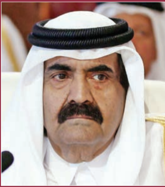
صاحب السمو الأمير التاجر الشيخ حمد بن خليفة آل ثاني

ذكرا في المقابل تم تعيين 1994 فردا في القطاع غير الحكومي منهم 984 أنثى و1010 ذكور، وتتوقع إدارة القوى العاملة زيادة تقطير الوظائف بنسبة 4٪ خلال الثلاث سنوات القادمة. لقد حققت وزارة الاقتصاد والتجارة القطرية عددا من الإنجازات البارزة تضاف لسجلها الحافل. وقد مثل تنفيذ مشروع أسواق الفرجان الذي أطلقته الوزارة بالمشاركة مع كل من وزارتي المالية، والبلدية والتخطيط العمراني، وغرفة قطر وبنك قطر للتنمية، واحدا من أهم تلك الإنجازات، إذ سيساهم بشكل فعال في إيجاد بيئة اقتصادية متنوعة ومستدامة وتعزز نمو القطاع التجاري لدفع عجلة النمو الاقتصادي بما يتماشى مع رؤية قطر الوطنية 2030.