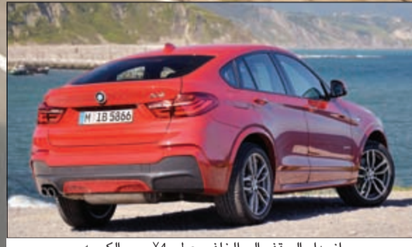
انحدار السقف إلى الخلف يعطي X4 روح الكوبيه