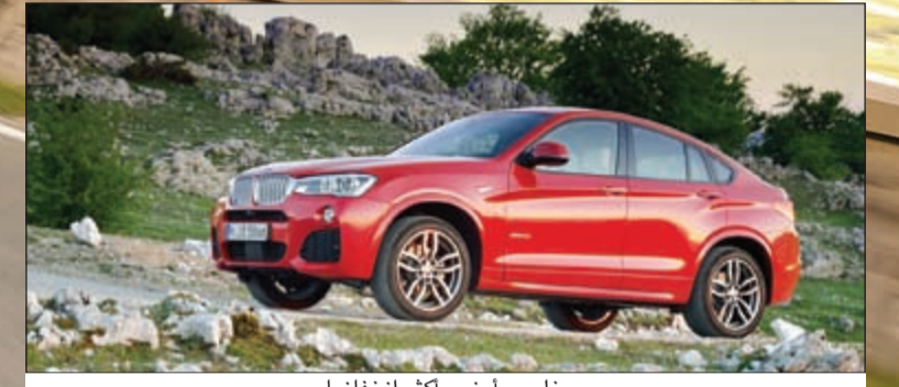
خلوص أرضي أكثر انخفاضاً