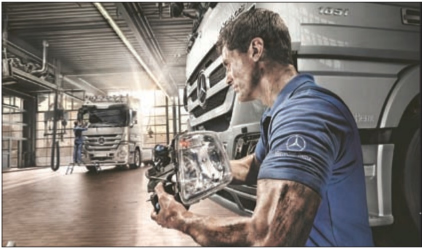
مرسيدس-بنز توصي عملاءها باستخدام قطع الغيار الأصلية

بناء على معايير مرسيدس-بنز العالمية وبأيدي فنيي وخبراء مرسيدس-بنز المعتمدين. ويؤكد إطلاق شركة عبدالرحمن البشر وزيد الكاظمي للحملات والعروض المميّزة على التزامها بتقديم وتوفير أعلى وأفضل الخدمات مع التطلع الدائم لتجاوز توقعات العملاء تحت شعار «رضاء عملائنا هو قوتنا الدافعة».