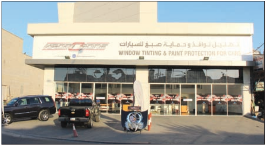
معرض كروموزون في منطقة الري

في خطوة جديدة تعكس اهتمامها المستمر بعملائها وتوفير أنسب الحلول والخدمات، افتتحت «كروموزون» لإكسسوارات السيارات، إحدى ابتكارات شركة يوسف أحمد الغانم وأولاده للسيارات، معرضها الجديد في منطقة الغانم، وتهدف «كروموزون» من خلال هذا المعرض لخدمة أكبر شريحة من العملاء مالكي جميع موديلات السيارات، الطواقين للاستفادة من الخدمة المميزة والمنتجات عالية الجودة والاحترافية العالية التي اشتهرت بها «كروموزون» طوال فترة تواجدها في سوق اكسسوارات السيارات في الكويت، للحصول على سيارة أكثر جمالا وتميزا بمواصفاتها ومظهرها الجديد.