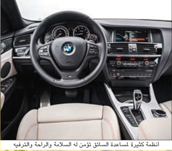
أنظمة كثيرة لمساعدة السائق تؤمن له السلامة والراحة والترفيه

تقنية التوربو الثنائي من BMW، والمحرك الأقوى في هذه المجموعة هو في سيارة xDrive35i BMW X4، وهو محرك يعمل بالوقود بست أسطوانات مستقيمة سعته 3 ليترات يولد قوة أقصاها 306 حصنة ويدفع السيارة من صفر إلى 100 كلم/ساعة في غضون 5,5 ثوان، بالإضافة إلى ذلك، تضم سيارة xDrive28i محركا رباعي الأسطوانات سعته 2 ليتر يولد 245 حصانا ويتسارع من صفر إلى 100 كلم/ساعة في غضون 6,4 ثوان.