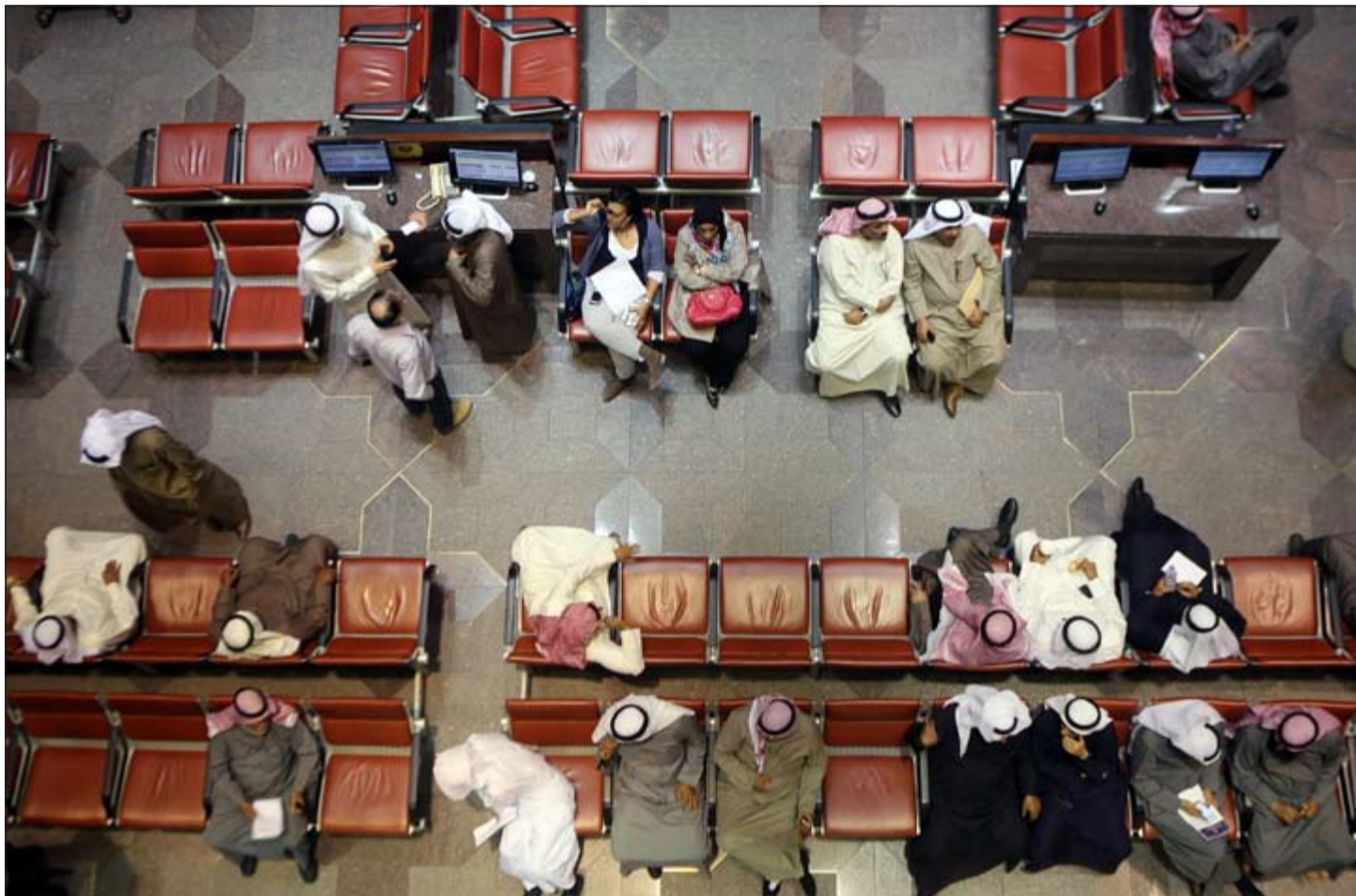
عودة السيولة بقوة إلى الأسهم الكويتية حيث يرى البعض فرصا في ظل أزمة تراجع الأسعار الحالية وفي الصورة ارتفاع في أعداد المستثمرين داخل قاعة البورصة

الرياض-رويترز: قال وزير المالية السعودي إبراهيم العساف أمس إن المملكة ستواصل الإنفاق على مشروعات التنمية في ميزانية عام 2015 رغم تحديات الاقتصاد العالمي. ونقلت وكالة الأنباء السعودية الرسمية (واس) عن العساف قوله إن الوزارة انتهت من إعداد ميزانية العام المالي القادم وتم عرضها على المجلس الاقتصادي الأعلى الذي يرأسه العاهل السعودي الملك عبدالله تهديدا لعرضها على مجلس الوزراء في أقرب العاجل. ونقلت الوكالة عن العساف قوله «بالرغم من أن الميزانية أعدت في ظل ظروف اقتصادية ومالية دولية تتسم بالتحدي إلا أن المملكة ومنذ سنوات طويلة اتبعت سياسة مالية واضحة تسير عكس الدورات الاقتصادية بحيث يستفاد من الفوائض المالية المتحققة من ارتفاع الإيرادات العامة للدولة في بناء احتياطي