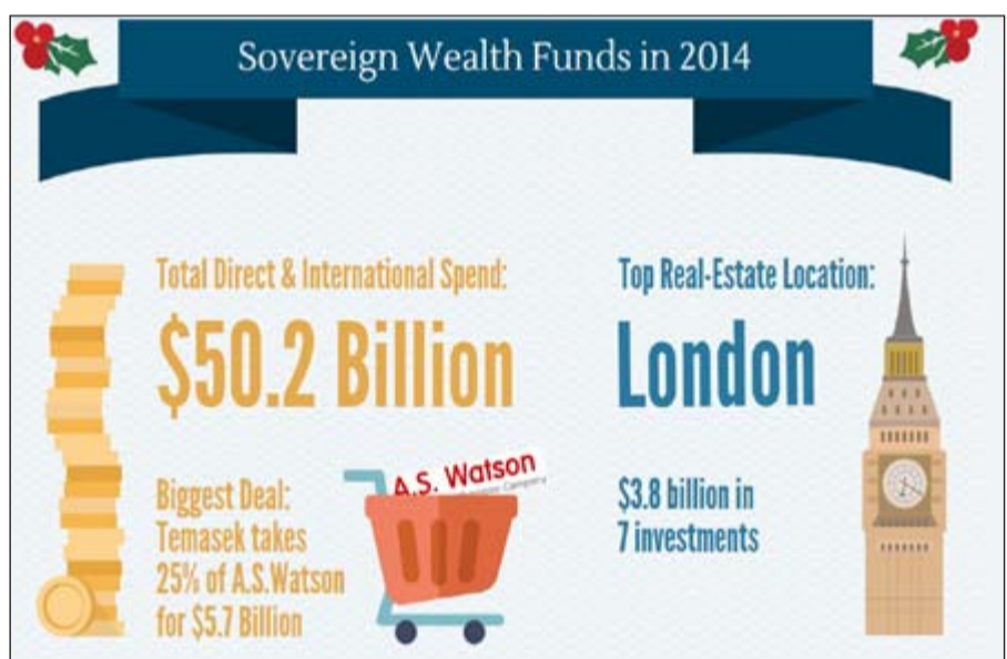
استثمارات الصناديق السيادية خلال 2014 وأهم الصفقات حسب القطاعات

أيه أس واتسون - 5,7 مليارات دولار. وعن التوزيع الجغرافي لاستثمارات الصناديق السيادية بلغت قيمة الاستثمارات في الصين 12,8 مليار دولار من خلال 42 صفقة، فيما بلغت الاستثمارات بالولايات المتحدة 7,3 مليارات دولار من خلال 44 صفقة، فيما بلغت الاستثمارات، وفي المملكة المتحدة 8,5 مليارات دولار من خلال 25 صفقة، وفي روسيا 2,5 مليار دولار من خلال 5 صفقات وفرنسا 1,5 مليار دولار من خلال 5 صفقات وفي البرازيل 1,1 مليار دولار من خلال 10 صفقات وإيطاليا 4,3 مليارات من خلال 10 صفقات. وعن استثمارات الصناديق السيادية وفقا للقطاعات الاقتصادية، فإن استثماراتها في العقار بلغت 18 مليار دولار، فيما بلغت 7 مليارات دولار في قطاع المواد الاستهلاكية، و6 مليارات في قطاع الخدمات المالية، و4 مليارات في قطاع المواصلات، و4 مليارات في مشاريع البنية التحتية، و3 مليارات دولار في قطاع الطاقة، و2 مليار دولار في قطاع العناية الطبية، ومليار دولار في قطاع الخدمات التجارية، و3 مليارات في الأنشطة الأخرى.