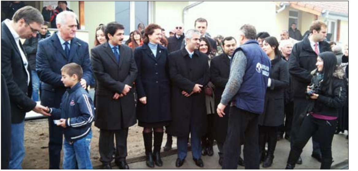
الرئيس الصربي ورئيس الوزراء إلى جانب السفير يوسف عبدالصمد خلال الاحتفال

ليشكل عملاً خيرياً خالصاً من دولة نصحها بالصديق الوفي. فيما هنا السفير يوسف عبدالصمد في الكلمة التي ألقاها أثناء الاحتفال الأهالي الذين سيستفيدون من التبرع الكويتي لإيوائهم في تلك الوحدات السكنية والتي جاءت كثرة للاتصالات والجمعيات التي عقدتها السفارة وجمعية الهلال الأحمر مع المسؤولين في الحكومة الصربية للخروج كاملة لإنجاز هذا المشروع الإنساني.