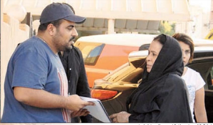
الفنانة القديرة حياة الفهد.. «الجدة لولو»