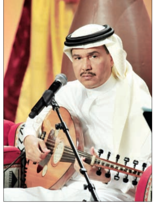
فنان العرب محمد عبده

وسيقام الاحتفال على المسرح المفتوح في الحي الثقافي «كتارا» الاثنين المقبل في تمام الساعة الثامنة مساءً، بحضور نخبة فنية وإعلامية وجماهيرية، حيث ذهب ريعه لدعم الجمعيات المعنية بالنشاط الإنساني الخيري في كل أرجاء العالم، وسيغني عبده عدداً من الأعمال التي يقدمها لأول مرة منذ أكثر من أربعين عاماً، والتي تمثل حقبة مهمة من ذاكرة الناس، وكذلك سيقدّم بعضاً من أغانيه الكلاسيكية المعروفة، بوجود فرقة موسيقية تزيد عن الـ 60 عزافاً بقيادة المايسترو وليد فايد الذي عاد إليه بعد غياب عن قيادة فرقته الموسيقية.