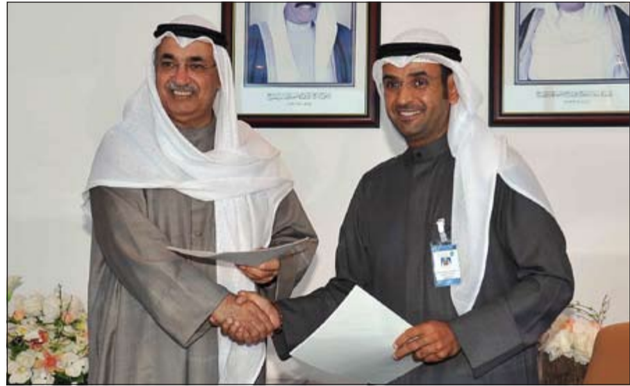
د.عبد المحسن المدعج ود.نايف الحجرف يتبادلان العقود عقب توقيع عليها

إلى طول الدورة المستندية من خلال تحديد الملفات والمعاملات التي ستكون بحوزة «التجارة» وما ستكون بحوزة «أسواق المال» بناء على القانون ولائحته التنفيذية. وأشار د.الحجرف إلى أنه سيتم تشكيل فريق مكون من الجهتين المتابعة والتنفيذ ومراعاة ما يظهر من مستجدات يجب أن تؤخذ بالاعتبار.