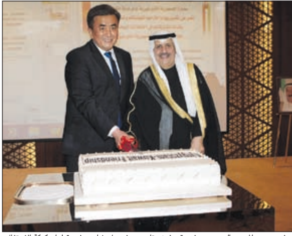
السفير الأردني مبارك