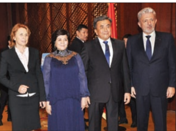
سفير أوكرانيا يهنئ

أن يدخلوا في كل المجالات الاقتصادية من دون قيود واغتنام الفرص». لافتا إلى «أن السفارة مستعدة لمساعدة الجميع في تنظيم أعمالهم وتابع: «بهدف جذب السياح ورجال الأعمال تم اقرار قانون اعفاء عدد من الدول ومن ضمنها الكويت من تأشيرة الدخول لمدة 60 يوما، وتأمل أن تساهم هذه الخطوة في جذب المستثمرين الكويتيين الذين هم مرحب بهم في الاقتصاد القبرغيزي» مبينا «أن هناك عددا من رجال الأعمال والشركات الكويتية بدأت تستثمر في قبرغيزستان». وتحدث عن اقامة الأيام الثقافية القبرغيزية في الكويت العام المقبل وأيضا الأيام الثقافية الكويتية في قبرغيزستان، معتبرا انها «ستوفر فرصة جيدة للتعريف بثقافة شعوبنا واقامة الاتصالات بين الفرق الابداعية»، مؤكدا «اننا مهتمون بتخصيص منح دراسية للطلبة الكويتيين في الجامعات الرائدة في قبرغيزستان والحصول أيضا على منح لطلبتهم في الجامعات الكويتية، والدعم المتبادل والفعال بين طلابنا يجب أن ينمو بشكل اكبر».