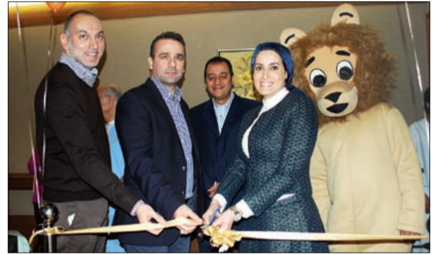
قص شريط افتتاح قسم الاطفال الجديد والموسع في مستشفى رويال حياة

افتتح مستشفى رويال حياة يوم 10 الجاري قسم الملاحظة والطوارئ لطب الأطفال الذي تم توسيعه وتجديده مؤخرا لإضافة مساحات أكبر وأجنحة وغرف مجهزة بأحدث الديكورات والتقنيات وأدوات الترفيه. وشكل هذا التوسع ضرورة لاستيعاب كمية أكبر من المرضى وإضفاء جو مريح وممتع ومناسب للأطفال لتكريس التفاؤل وضمان العلاج ونتائجه بروح تراعي براءة الأطفال وتغذي خيالهم، كما تراعي المساحات الإضافية توفير التقنيات الطبية الحديثة في جميع الأقسام والغرف لمساعدة الأطباء المتفرسين على توفير الرعاية المتطورة بأساليب حديثة.