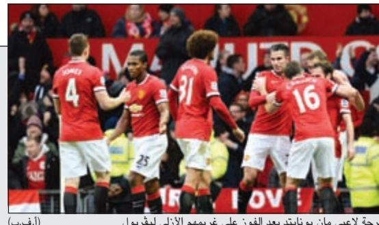
فرحة لاعبي مان يونايتد بعد الفوز على غريمم الأيرلي ليفربول