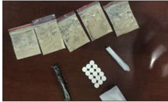
جانب من المضبوطات

بحوزته على عدد 5 أكياس هيروين وأصبح حشيش و15 حبة روش، كما ألقى رجال نجدة الجهراء أيضا القبض على شابين من غير محددى الجنسية وعثر بحوزتهما على سيجارة بها حشيش وقطعة من الحشيش أيضا، واحيلا إلى الإدارة العامة لمكافحة المخدرات.