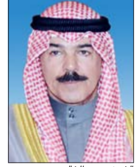
الشيخ محمد خالد