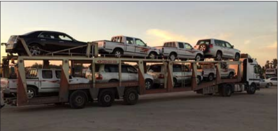
المركبات المخالفة في طريقها إلى كراج الحجز