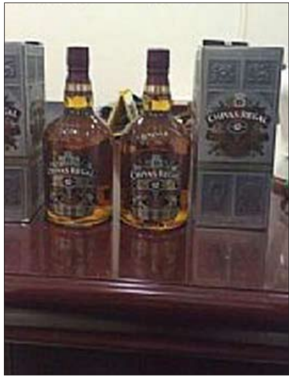
الخمر لم تصل إلى المشتري بسبب الارتباك