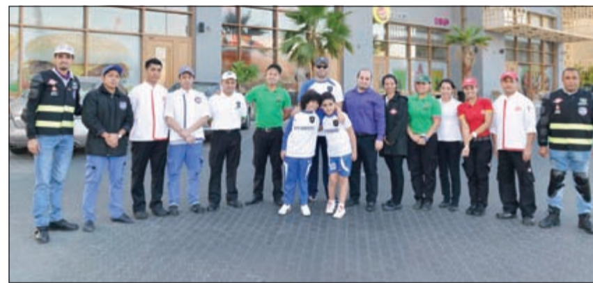
عدد من المشاركين بالرحلة مع فرق مطاعم سابيكو

بأشهى الحلويات المعدة في مطعم ميود بأسلوب مميز وصحي وباشكال لافتة، كما استمتع الضيوف بالأجواء الرائعة وبالإطلالة المميزة للموقع الرائع على شارع البلاجات مقابل شوبيز والتراس الخارجي الجميل في واحد من أفضل المطاعم في الكويت، بما يقدمه من أجواء أسرية وماكنة لذيذة معدة على أيدي أمهر الطهاة، وبما يلبي رغبات الذواقة من شتى أصناف المأكولات والعصائر والحلويات.