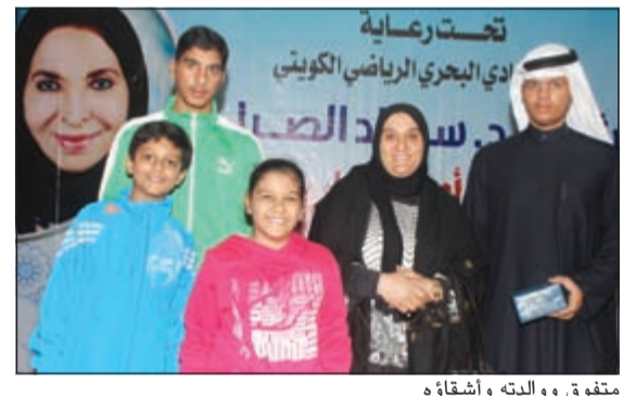
متفوق ووالده وأشقاؤه