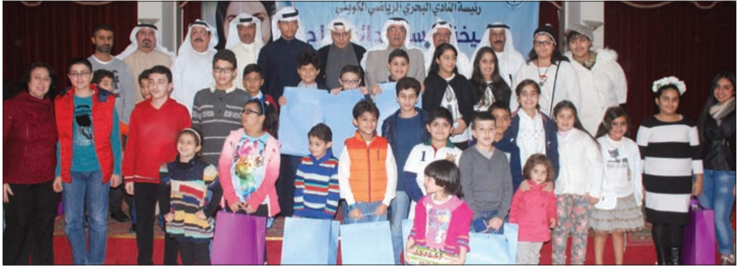
لقطة تذكارية للمتفوقين وأولياء أمورهم وإدارة النادي

تكريسا لقيم الجودة والإبداع والعناية بالتفاصيل والبراعة الحرفية العالية التي لطالما اشتهرت بها «سلفاتوري فيراغامو»، ابتكرت العلامة تشكيلة فاخرة من ثلاثة عطور تتيح استكشاف أفاق عطرية مفعمة بالأحاسيس من خلال أكثر روائح إقليم توسكانا سحرًا وهي: الميموزا البيضاء (وايت ميموزا)، والأكاسيا الذهبية (جولدن أكاسيا)، والجلد المخملي (إنسينس سود). وتزدان قوارير العطر الفاخرة بغطاء مصنوع يدويا من خشب جذور الورد البري في إقليم توسكانا الإيطالي، وهي ترمز إلى القوة والثقة لمنح كل قارورة طابعًا متفردًا. ويتألق على غطاء القارورة شعار Gancino محفور بلون ذهبي يتناغم مع لون الحروف المكتوبة على القارورة بأسلوب بالغ الفخامة، ويتناقض بشكل لافت مع أنيقة اللون الأسود للقارورة. ويأتي هذا العطر الساحر ضمن علبه سوداء عصرية ذات ملمس جلدي ناعم مع إطار ذهبي لماع يبدو أشبه بمنضخة عرض سحرة تحمل القارورة.