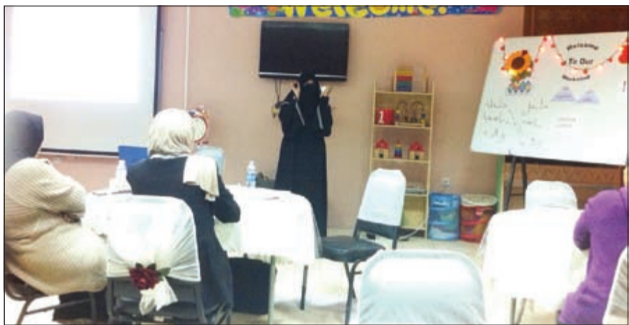
جانب من الورشة التدريبية

الإخطاء والعقبات التي تعترض مسيرة الأشخاص نحو التميز خصوصا في المجال التربوي والتعليمي بما يتعلق بالطلبة في جميع مراحلهم الدراسية وكذلك المعلمات أثناء أداء واجباتهن المهنية. وقد توجهت ادارة المدرسة الى المحاضرة العجمي بالشكر على ما قدمته من معلومات.