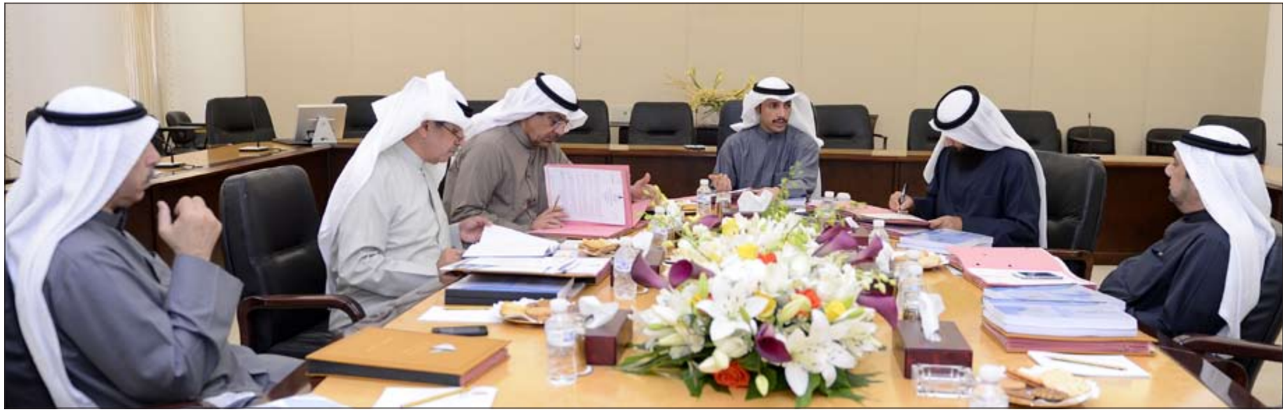
رئيس مجلس الأمة مرزوق الغانم مترأساً اجتماع مكتب المجلس

من جهته، بعث رئيس مجلس الأمة مرزوق الغانم ببرقية تهنئة إلى رئيس الجمعية الوطنية في بوركينا فاسو سونغالو أبولناير أوتارا، وذلك بمناسبة العيد الوطني لبده.