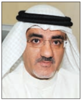
د. خليل عبدالله

قدم النائبان د.عودة الرويحي ود.خليل عبدالله اقتراحا برغبة جاء فيه: نظرا للحاجة لتحديد المسؤوليات وعدم ازدواجية القرارات بوجود ما يسمى مجلس الوكلاء في الوزارات مما قد يؤثر ويحول دون تحديد المسؤوليات والمهام المنوطة بالوكلاء كل على حدة، ايضا لمنع ازدواجية القرارات الصادرة من الوزير او التعميمات او التوصيات الصادرة من مجلس الوكلاء والتي قد يعتبرها البعض انها بقوة القانون، ونظرا للمصلحة العامة، فإننا نتقدم بالاقترح برغبة التالي: إلغاء مجلس الوكلاء في جميع الوزارات حتى لا تتداخل الصلاحيات