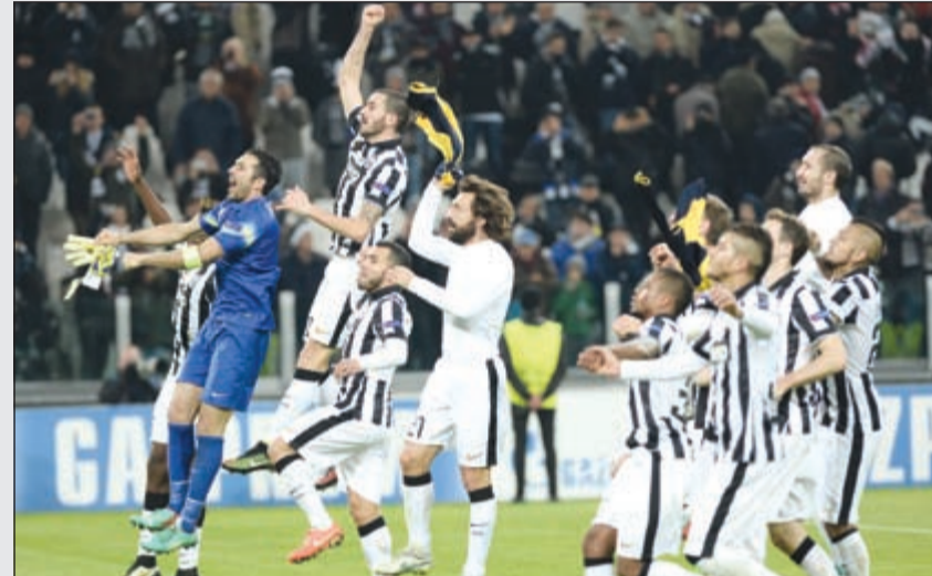
سعادة بالغة للاعبين اليوفي

حقق يوفنتوس بطل إيطاليا المطلوب من مباراته مع ضيفه اتلتيكو مدريد بطل اسبانيا ووصيف العام الماضي ولحق به الى الدور الثاني من مسابقة دوري أبطال أوروبا بتعادله معه 0-0، فيما ودع ليفربول الإنجليزي بتعادله على أرضه 1-1 مع بازل السويسري الذي حجز بطاقته كما حال موناكو الفرنسي ايضا.