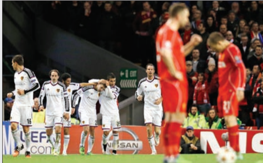
فرحة بازل.. واحزان الليفر

على ملعب «أنفيلد» وفي المجموعة الثانية، فشل ليفربول في الاستفادة من عاملي الأرض والجمهور لكي يحجز مقعده في الدور الثاني للمرة الأولى منذ موسم 2011-2012 واكتفى بالتعادل مع بازل 1-1، ما سمح للاخير بالاحتفاظ بمركزه الثاني.