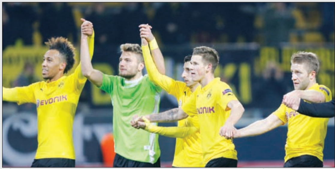
دورتموند يصالح جماهيره بالتأهل لدور الـ 16

عشر في الدوري المحلي، رصيده الى 13 نقطة في الصدارة بفارق نقطة عن الاخير امام ارسنال بفارق نقطة عن الاخير الذي عاد من تركيا بفوز كبير على غلطة سراي 4-1.