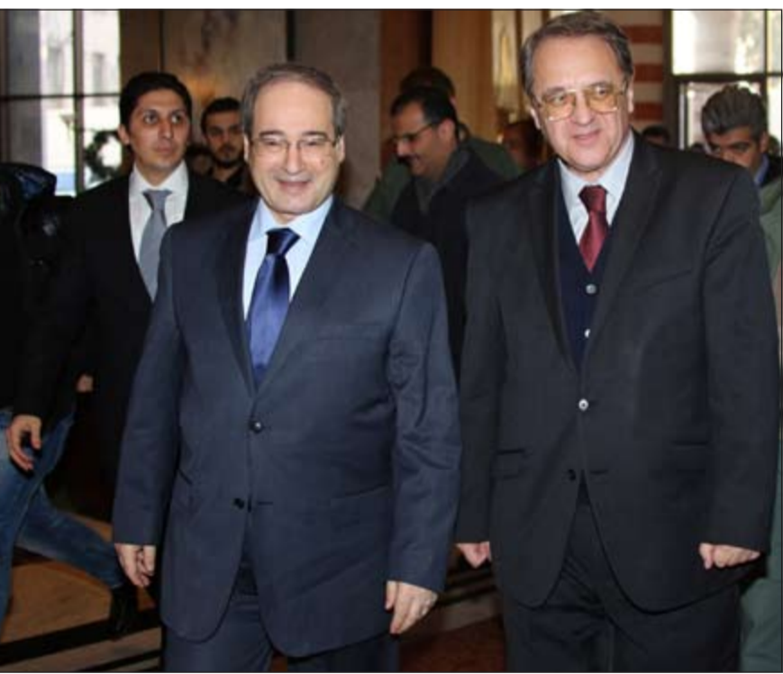
نائب وزير الخارجية السوري فيصل المقداد مستقبلا نظيره الروسي ميخائيل بوغدانوف في دمشق امس