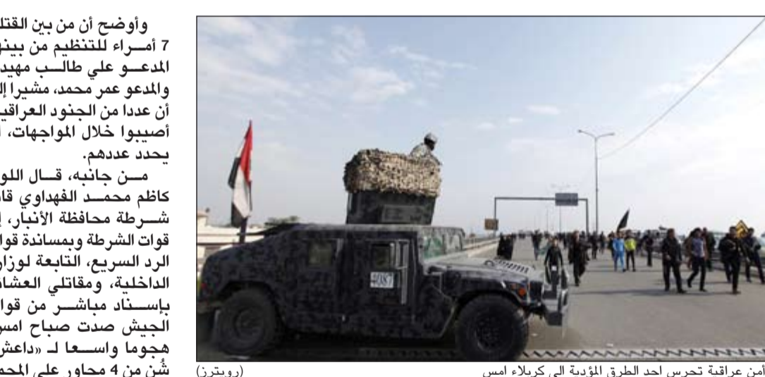
قوات أمن عراقية تحرس أحد الطرق المؤدية الى كربلاء امس

المخيم، يملكون خبرة سابقة في قتال الشوارع. وكشف حمداني عن أنهم سيتسلمون خلال الأيام القليلة المقبلة، أسلحة ثقيلة لإطلاق عملية تحرير الموصل بمساعدة قوات الجيش، والدعم اللوجستي المقدم من الولايات المتحدة، مشيرا إلى أن العملية لن تنجح دون الدعم الجوي الأميركي، ومساندة الجيش، وإلا فإنها ستستمر طويلا، على الرغم من خسارة تنظيم داعش جزءا من قوته. الى ذلك، قال مسؤولان عسكريان عراقيان، امس إن 60 عنصرا من «داعش» قتلوا خلال مواجهات بين القوات الحكومية وعناصر التنظيم في كل من مدينتي الفلوجة والرمادي التابعتين لمحافظة الأنبار غربي البلاد. وفي تصريح قال اللواء قاسم الحمدي قائد عمليات الجيش العراقي، إحدى تشكيلات الجيش العراقي، إن 45 عنصرا من «داعش» قتلوا امس خلال مواجهات بين القوات الحكومية المدعومة من مقاتلي العشرات الموالية لها ومقاتلي التنظيم في منطقة الكرمة شرقي الفلوجة التي يسيطر عليها «داعش» ومنطقة الهيتاوين جنوبي المدينة والسجر شمالها.