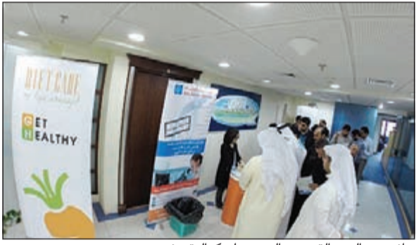
جانب من اليوم التوعوي الصحي لـكواليتي نت»