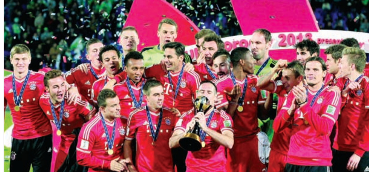
بايرن ميونيخ الألماني حامل لقب النسخة السابقة