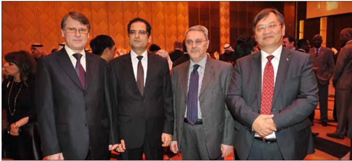
سفراء روسيا وتونس والعراق خلال الحفل

التبادلة بين البلدين على مستوى كبار المسؤولين في توطيد وتنمية العلاقات الثنائية، وخصوصاً الزيارة التي قامت بها رئيسة الوزراء التايلندية للكويت اثناء استضافتها منتدى الحوار الآسيوي».