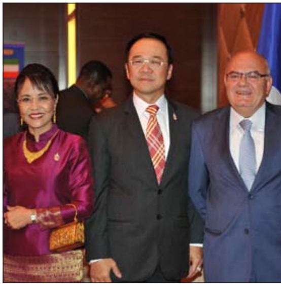
السفير البناني مهننا (اسامة ابو عطية)

برعاية وإشراف مراقب الخدمات الاجتماعية النفسية عبدالله البركة وبحضور موجهي وموجهات الخدمة الاجتماعية ووفد من مجلس الأمة، وفي تنظيم رائع في ثانوية ام مبشر جرت انتخابات اللجنة التنفيذية