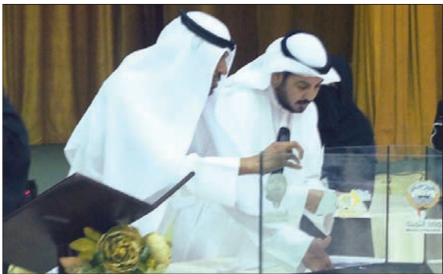
جانب من الغز

للمجلس الأعلى لمجلس الطالبات على مستوى منطقة الجهوراء التعليمية، وقد تم اختيار رئيسة المجلس ونائبة الرئيس وأمينة السر والعضو الرابع في جو ديموقراطي ام مبشر جرت انتخابات اللجنة التنفيذية