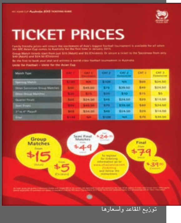
توزيع المقاعد وأسعارها

تلقت «الأنباء» نسخة من كتاب «تاريخ كرة القدم في استراليا» مؤلفه روي هاي وبيل موراي، خلال مؤتمر صحافي في مقر الاتحاد الأسترالي لكرة القدم في سيدني عندما زارت استراليا ضمن البعثة الدبلوماسية الرياضية في مايو الماضي، حيث يستعرض الكتاب بدء كرة القدم الأسترالية وكيف تطورت وكيف سبقتها ألعاب أخرى، لاسيما الرغبة وكرة القدم الأسترالية التي تختلف عن السوكر إلى جانب صور تاريخية أرشيفية ومحطات مهمة نجح في تدوينها المؤلفان بأسلوبهما الشيق والراقي، لاسيما أنها عاصرا الرياضة الأسترالية منذ 40 عاماً.