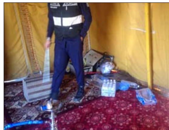
أحد رجال الامن يعاين محتويات الخيمة

قام رجال أمن محافظة الجهراء بشن حملة بعد ورود معلومات السي مدير الأمن اللواء الطراح الذي شكل فرقة بقيادة المقدمين مطر السبيل وعبدالله الحيشي والنقيب مبارك هيف الجحرف وتم ضبط 14 شخصاً دون اثبات ومصادرة خيمة تحتوي على إطارات وجراكل بنزين لإسعاف سيارات المستهترين ان نفذ الوقود منها. وقال مصدر امني: ان رجال أمن الجهراء قاموا بمداهمة إحدى الطرقات التي خصصها المستهترون كساحة على طريق الأرتال للاستعراض بمركباتهم ومداومة خيمة