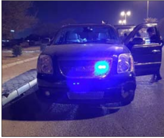
مركبة المشتبه بهم تشبه إلى حد بعيد دوريات حماية الشخصيات