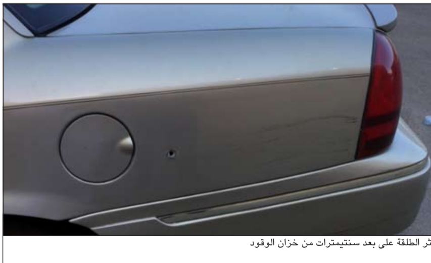
أثر الطلقة على بعد سنتيمترات من خزان الوقود

تقدم مواطن إلى مخفر ابوخليفة متهما شخصاً مجهولاً بتحريض زوجته على الفسق والاعتداء عليها بالضرب. وقال المبلغ انه كان برفقة زوجته في سوق تجاري بمنطقة ابوخليفة، حيث قامت زوجته بالذهاب إلى السيارة لانتظاره لوجود أعراض كان أحد