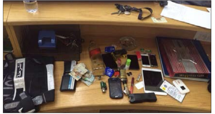
المضبوطات تنوعت بين أدوات أمنية ومواد مخدرة ومسكرة