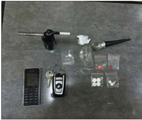
بعض الأدوات والمخدرات المضبوطة