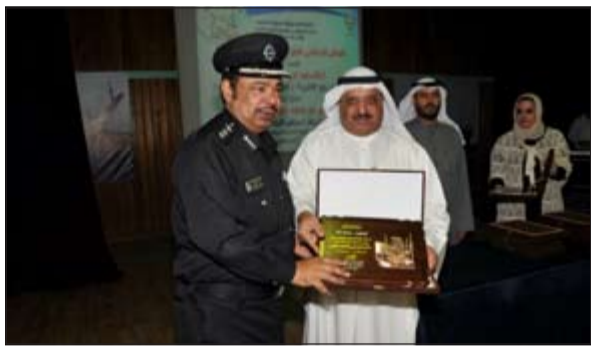
العقيد الملا اعتبر مكافحة العنف مسؤولية مشتركة

بناء على اوامر وكيل لشؤون الامن العام اللواء عبدالفتاح العلي، احال مدير عام مديرية امن الجهراء اللواء ابراهيم الطراح الى ادارة بحث وتحري الجهراء 4 اشخاص (مواطن وعسكري مفصول من امن الحدود وسوري واردني) للتحقيق معهم في قضايا مرتبطة بقضايا سلب بالاكراه وانتحال صفة مباحث وحيازة مواد