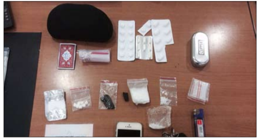
المخدرات التي ضبطت مع «البدون» في مخفر النعيم