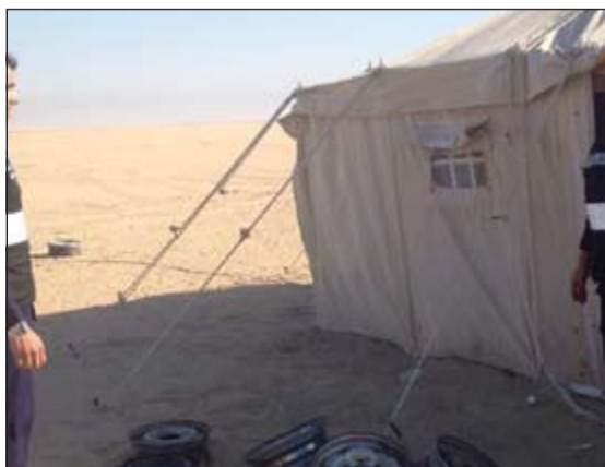
الخيمة من الخارج

شخصاً لا يحملون أي اثبات، بالإضافة إلى ضبط 3 مطلوبين وشخصين بدون بانتهاة إقامة.