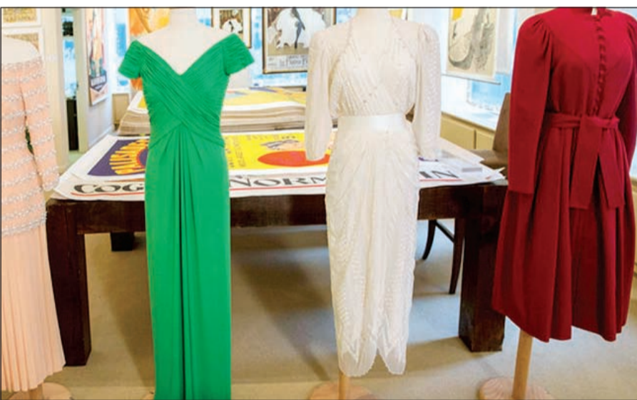
فساتين أميرة القلوب

وتراوحت أسعار الفساتين الأربعة الأخرى بين 60 و125 ألف دولار، وكانت ثلاثة فساتين من بينها من تصميم «كاترين ووكر» التي أصبحت صديقة شخصية للأميرة. وكانت هذه الفساتين بيعت مرة من قبل الأميرة قبل شهرين على وفاتها في حادث سير في باريس في أغسطس 1997، لتمويل جهود إزالة الألغام المضادة للأفراد، وأقامت المزاد دار «جوليينز أوكشينز» في بيفرلي هيلز.