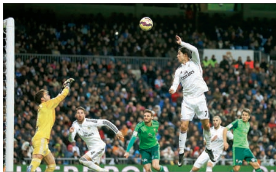
رونالدو فوق الجميع بامتياز

وافتح فولفسبورغ التسجيل في وقت مبكر عبر البلجيكي كيفن دي بروين (4)، وادرك هانوفر التعادل مع صافرة نهاية الشوط الأول بواسطة الإسباني خوسيلو. وفي الشوط الثاني، استعاد فولفسبورغ المبادرة الهجومية وسجل هدفه الثاني عبر رأسية للهولندي باش دوست (69).