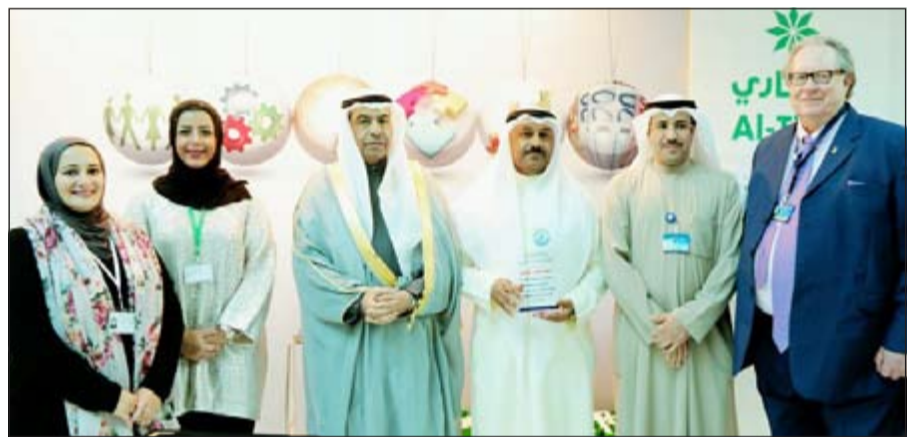
جانب من تكريم «التجاري»

والكوادر الوطنية المؤهلة للعمل بالقطاع المصرفي حيث نوفر لهم في البنك فرصة لتحقيق طموحاتهم المهنية وبناء وتطوير أنفسهم». وأضاف أمين أن «التجاري» يحرص دائماً على استقطاب الكوادر الكويتية في إطار خطته الطموح للإحلال والتعاقب الوظيفي، بل ويسعى إلى تخطيط مساراتهم الوظيفية بهدف خلق جيل واعد من المصرفيين الجدد، مشيراً في هذا الصدد إلى أن مساعي البنك لزيادة نسبة العمالة الوطنية لديه تأتي في إطار خطة توطيد الوظائف واستجابة لجهود تنمية العنصر البشري بالدولة.