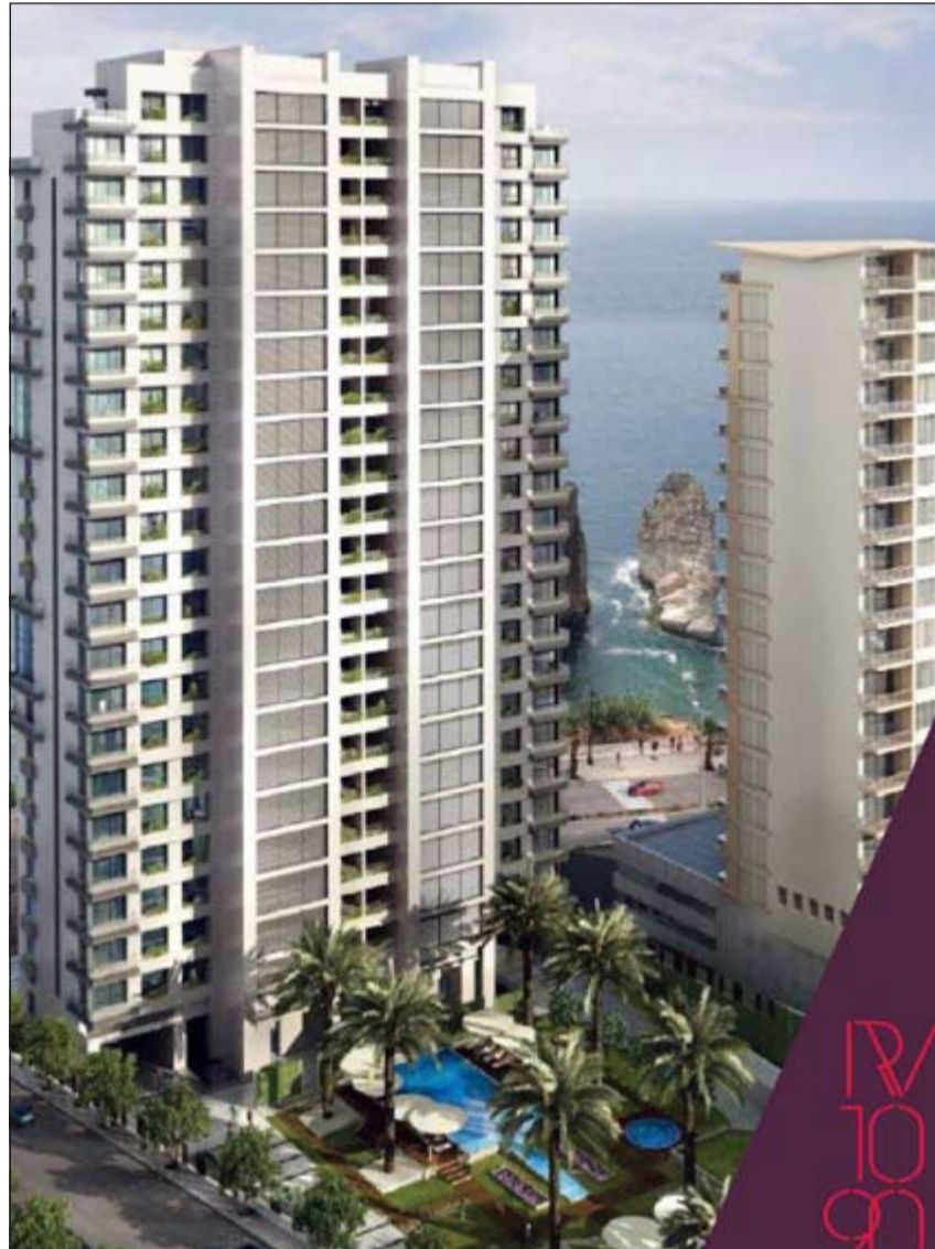
مشروع الروشة فيو 1090