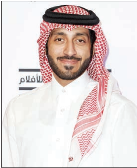
المخرج يوسف المعصدي

الجمهور بجانب الورش والاجتماعات المخصصة لصناعات السينما، على أن يساهم مقدمو الورش الرئيسية «قمره» في اختيار الأفلام التي سيساهمها الجمهور. وستنقسم فعالية «قمره» إلى 3 أقسام رئيسية وهي: ورش «قمره» السينمائية وهي جلسات يومية يقدمها أحد مقدمي الورش الرئيسية ويمكن لصناعات الأفلام المشاركين حضورها والاستفادة منها، كما ستفتح أبوابها لضيوف الفعالية من صناعات السينما على أن تقتصر مشاركتهم على الحضور. والقسم الثاني هو اجتماعات «قمره» والتي ستشتمل سلسلة من الاجتماعات والورش والجلسات التدريبية المنفردة بين خبراء صناعة السينما والقائمين على المشاريع السينمائية الخمسة والعشرين والتي تم اختيارها للمشاركة في الفعالية. ويأتي القسم الثالث وهو عروض «قمره» السينمائية ل يتيح للجمهور فرصة متميزة لمشاهدة المشاريع السينمائية الممولة من قبل مؤسسة الدوحة للأفلام من خلال برنامجي المنح والتمويل المشترك، بالإضافة إلى مجموعة من الأفلام التي اختارها مقدمو الورش الرئيسية «قمره» وستلبيها جلسات نقاشية حول مضمونها. وسيتولى فريق مؤسسة الدوحة للأفلام تنفيذ فعالية «قمره»، بالتعاون مع مهرجان سيراويو السينمائي في إطار شراكته المستمرة مع المؤسسة، وسيواصل المخرج الكبير إيليا سليمان دوره كمستشار فني لكل من مؤسسة الدوحة للأفلام وفعالية «قمره»، كما سيشترك كل من باولو بيرتولين وفوليتا بافا كمستشارين للبرمجة والصناعة.