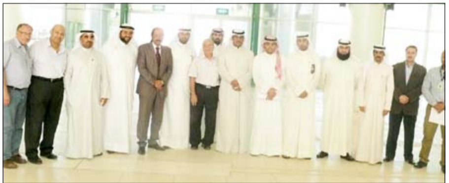
صورة جماعية بعد تسلم المبنى

لكل من ساندنا ووقف إلى جانبنا طوال الفترة الماضية لإنهاء إجراءات المبنى بصورة سريعة وهم: وزارة الأشغال، وزارة المالية، إدارة الإطفاء، محافظ القروانية الشيخ فيصل الحمود، جهاز متابعة الأداء الحكومي، مختار المنطقة ومساهمو الجمعية.