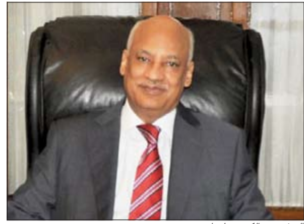
السفير عبدالكريم سليمان

أشاد السفير المصري في البلاد عبدالكريم سليمان بالعمل الخيري الكويتي، مؤكداً أن مساهمات أهل الكويت الخيرية جابت الكرة الأرضية ووصلت إلى جميع بقاع المعمورة، وذلك بتوجيه من صاحب السمو الأمير الشيخ صباح الأحمد الذي استحق أن تكرمه الأمم المتحدة وتطلق عليه لقب قائد العمل الإنساني واستحققت الكويت في عهده أن تكون مركزاً للعمل الإنساني.