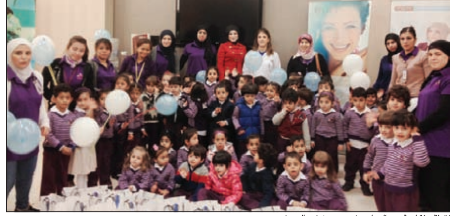
لقطة تذكارية مع البراعم في مستشفى السيف

الصحة الفموية والاهتمام بالأسنان وثانياً للاطمئنان على صحة أسنانهم بالكشف المبكر عن أي تسوس أو تشوه في أسنانهم. في أسنانهم. من جهتها، ثمنت إدارة مجموعة حضانة نجوم المستقبل جهود مستشفى السيف وعبرت عن شكرها للدعوة التي تلقتها الحضانة من إدارة المستشفى وأشادت بحسن التنظيم والاستقبال وقالت مشرفة البراعم: «لا شك أن زيارة أطفالنا لمستشفى السيف ستترك أثراً طيباً لدى براعمنا وستعزز لديهم الوعي بأهمية الحفاظ على صحتهم من خلال دمج ما تعلموه في الحضانة من معلومات نظرية بما شاهدوه وتعرفوا عليه هنا خلال الزيارة».