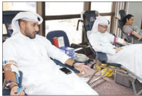
موظف الأهلي الكويتي يتبرع بالدم

بنك الدم المركزي لإتاحة الفرصة لموظفي البنك للتبرع بالدم بمساعدة من هم بأمر الحاجة لتوفير الدم لهم، بالإضافة إلى الفوائد الصحية الكثيرة التي يحصل عليها جسم الإنسان من عملية التبرع بالدم وتجديد خلايا الدم وتنشيط الدورة الدموية. وفي ختام اليوم قامت الزبائن بتقديم الشكر إلى بنك الدم المركزي على جهودهم المبذولة وجهود الطاقم الإداري والطبي على تعاونهم المستمر مع البنك في تنظيم هذا اليوم بشكل مستمر. ومن جانبه أعرب الفريق الطبي في بنك الدم المركزي عن سعادهته بهذه المبادرة الطبية من قبل البنك الأهلي الكويتي وتقدم بالشكر الجزيل إلى قسم العلاقات العامة.