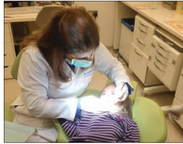
فحص أسنان إحدى الطالبات