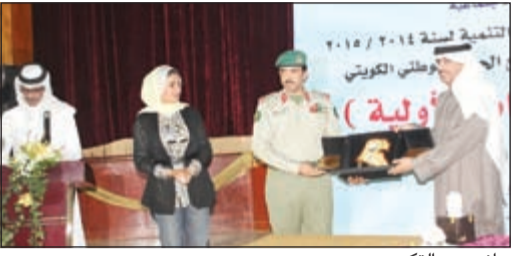
جانب من التكرير