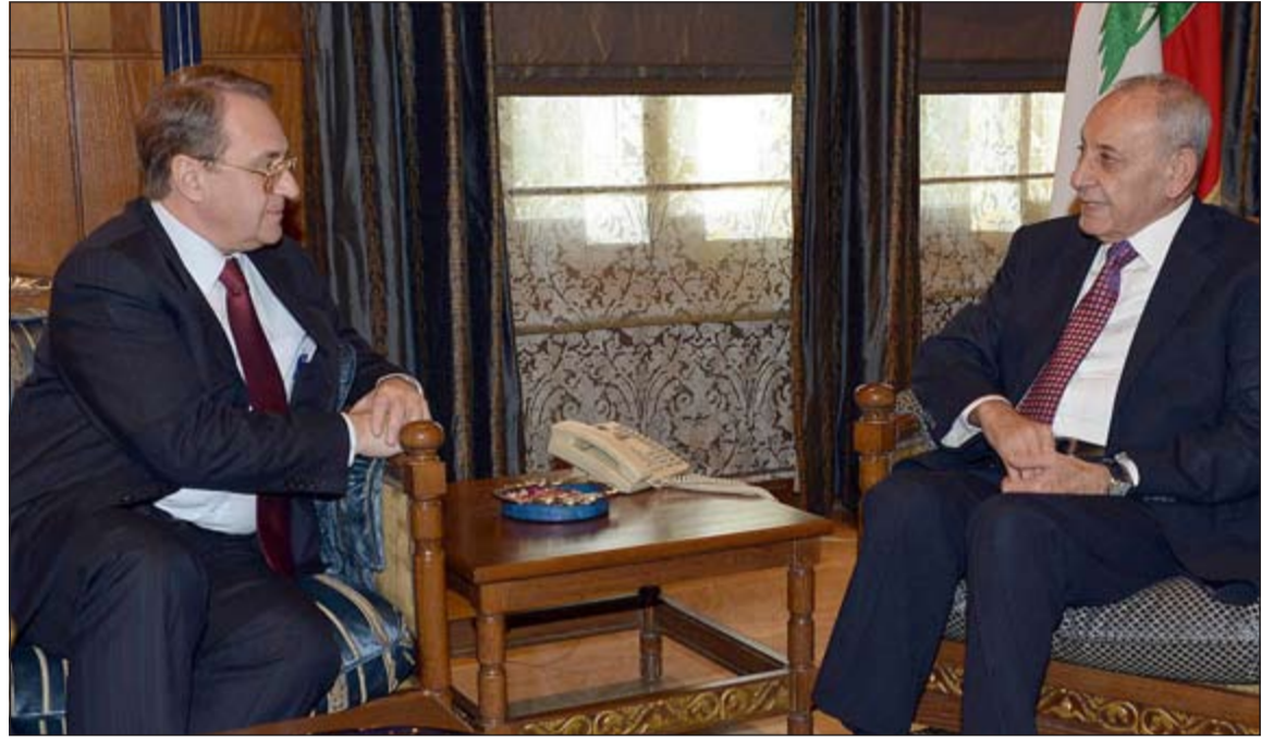
رئيس مجلس النواب نبيه بري مستقبلاً نائب وزير الخارجية الروسي ميخائيل بوغدانوف (محمود الطويل)

من جهته، دعا رئيس الحكومة تمام سلام الى متابعة ملف المخطوفين والمفاوضات الجارية من اجل اطلاقهم بتكتم ومسؤولية بعديين عن الاعلام «لأن التعقبة الاعلامية لا تساعد ما يبذل من جهود». في هذا الوقت، تباينت المعلومات حول تحركات الوسيط القطري احمد