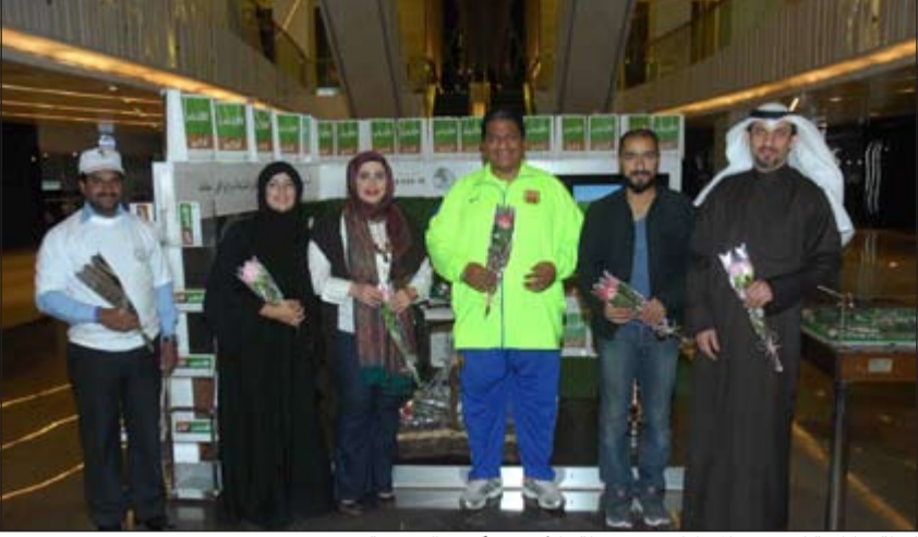
لقطة تذكارية لعدد من المشاركين في حملة «الأخضر أكبر» التوعوية