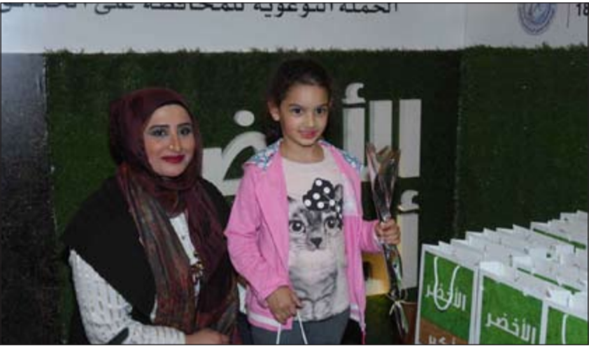
... وتشجيع للمصغار على الاهتمام بالزراعة والثروة النباتية والبيئة

التي تقدمها لأبناء الكويت بالإضافة إلى تحسين البيئة والمناخ.