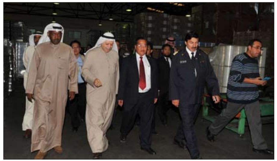
جولة تفقدية للوفد الكمبودي

نحو 25 ألف دينار. كما تحدث الطرفان عن العناصر الاساسية في عمل منطقة حرة يتم من خلالها استيراد وتصدير البضائع، وضمان الامن والسلامة للعاملين والمركز المالي وتوفر جميع الخدمات اللازمة للعاملين في المنشأة.