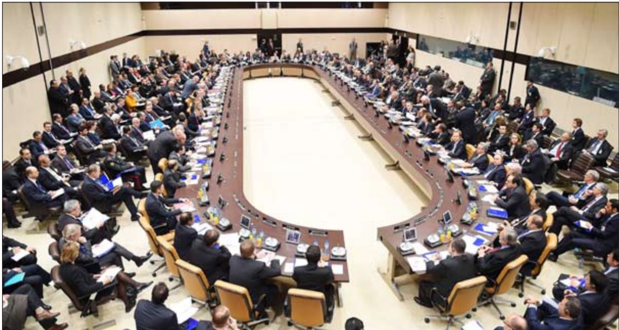
وزراء دول التحالف الذي تقوده الولايات المتحدة ضد داعش في بروكسل أمس

أخرى التنسيق مع المجتمع الدولي لتجفيف مصادر تمويل الجماعات الإرهابية، وفضح الطبيعة الإجرامية لهذه الجماعات التي تتنافى وتعاليم الإسلام السمحة». ونبه إلى أن التصدي للارهاب «سيستغرق وقتا طويلا، ويتطلب جهدا متواصلا». وبين أنه «من منطلق حرص المملكة على استمرار تماسك هذا التحالف ونجاح جهوده، فإننا نرى أن هذه الجهود «الإقصاء الطائفي». وأشار إلى «أن استضافة الملكة للمؤتمر جرة في سبتمبر الماضي شكل نواة هذا التحالف الدولي ضد تنظيم داعش الإرهابي». وتابع بأن مساهمة الملكة «لم تقتصر على المشاركة في العمليات العسكرية ضد التنظيم فقط، بل امتدت لتشمل تقديم المساعدات الإنسانية للشعب العراقي الشقيق من جهة، ومن جهة