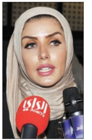
شقيقة الغانم تتحدث لوسائل الاعلام