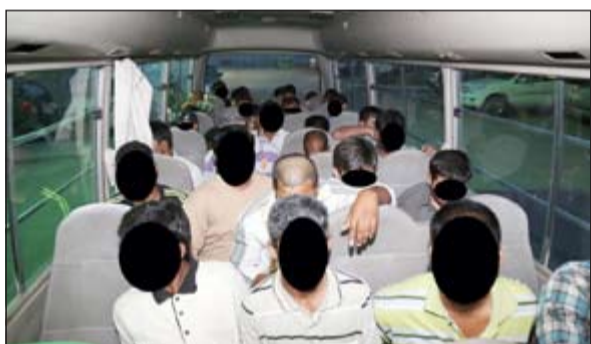
المخالفون في طريقهم إلى الإبعاد الإداري

ضمن الاستراتيجية الأمنية التي تتبعها قطاعات وزارة الداخلية لحفظ الأمن وتحقيق الاستقرار في كل محافظات الكويت قامت الفرقة الأمنية التابعة للإدارة العامة لمباحث شؤون الإقامة بحملة أمنية في منطقة الري الصناعية، وأسفرت تلك الحملة عن ضبط 60 مخالفا لقانون الإقامة وتم تحويلهم إلى جهات الاختصاص لاتخاذ الإجراءات القانونية اللازمة بحقهم. وتؤكد الإدارة العامة لمباحث شؤون الإقامة استمرار الحملات الأمنية لمواجهة الخارجين على القانون وضبط المخالفين وتحقيق الأمن والأمان للمواطنين والمقيمين، كما تشير إلى ضرورة الالتزام بالقوانين المتبعة في البلاد والحرص على حمل إنذبات الشخصية