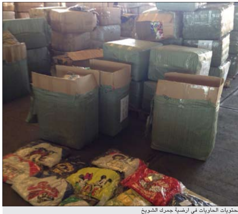
محتويات الحاويات في ارضية جمرک الشویخ

شهدت منطقة الصليبخات مساء أول من امس جريمة قتل بشعة راح ضحيتها مواطنة تبلغ من العمر 55عاما بعد أن سددها زوجها الإيراني عدة طعنات أودت بحياتها قبل ان يقدم هو على محاولة الانتحار عن طريق طعن نفسه في صدره أمام أفراد أسرته، إلا أنه لم يفارق الحياة ولا يزال يتلقى العلاج في مستشفى الصباح. وفي التفاصيل التي رواها مصدر أمني ان غرفة عمليات