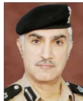
اللواء ابراهيم الطراح

ضبط العشرات من مخالفين قانون الإقامة والمخالفين، وضبط مواطن مطلوب للسجن 5 سنوات وبلغت عدد التفتيشات لأمن الجهراء 10 نقاط تفتيش. أما في نطاق محافظة العاصمة فقد شنت مديرية أمن العاصمة حملات تفتيش ليلية عبارة عن 12 نقطة تفتيش وأسفرت عن ضبط مطلوب جنائي وآخر مدني ومركبة مطلوبة خيانة أمانة، كما ضبط في نقطة تفتيش أخرى في محافظة العاصمة مطلوب للسجن 16 شهرا وآخر مطلوب للسجن لمدة عام وتم توقيف 19 مخالفا لقانون الإقامة. وفي حولي قامت مديرية أمن حولي بتحرير 160 مخالفة مرورية، أما في الغرمانية فتم ضبط 3 أشخاص بحوزتهم مواد مخدرة وتمت إحالتهم الى الإدارة العامة لمكافحة المخدرات، كما ضبط أمن الغرمانية مركبة مبلغ عن سرققتها، والي محافظة الاحمدي تم توقيف 20 مخالفا لقانون الإقامة ومواطن مطلوب للإدارة العامة لمكافحة المخدرات.