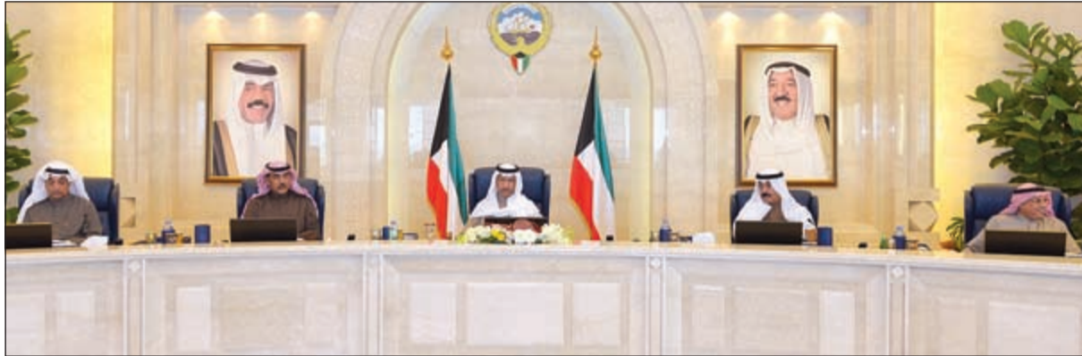
سمو رئيس مجلس الوزراء الشيخ جابر المبارك مترئسا جلسة أمس وبيدو الشيخ صباح الخالد والشيخ محمد الخالد والشيخ خالد الجراح ود. عبدالمحسن المدعج

إلى استعراض الترتيبات الخاصة لاستضافة الكويت للدورة الـ 42 لمجلس وزراء خارجية دول المنظمة خلال شهر مايو المقبل.