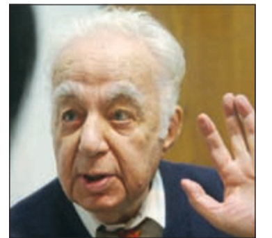
الراحل سعيد عقل

بيروت: اليوم يشيع لبنان الفئانة صباح، وبعد غد يمشي في جنازة سعيد عقل الشاعر اللبناني الأشهر. قد تكون صباح أخذت حقها تأبيننا وإشادة وعودة الزمن الجميل من قبل وسائل الاعلام اللبنانية، ومن هنا كان التركيز امس على الشاعر الذي مزج الحكمة بالفلسفة والعاطفة بالبيان، انه سعيد عقل، شاعر لبنان الذي غطى قرنا من عمر الوطن وانطفأت شمعته عن 102 عام.