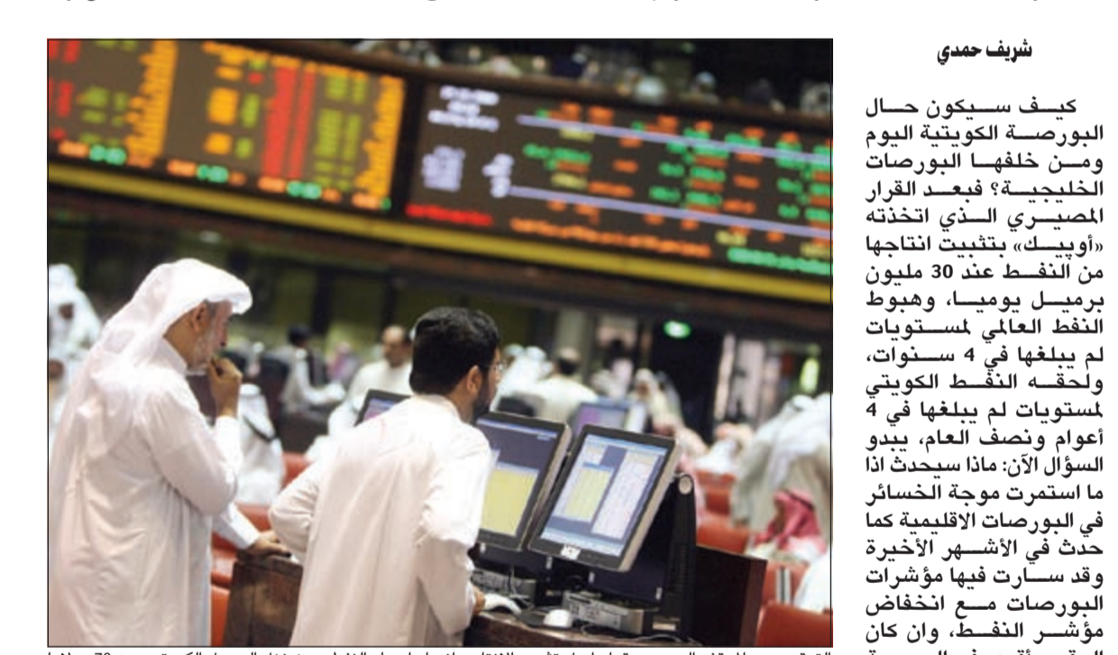
الترقب سيد الموقف اليوم بعد قرار اوبك تثبيت الانتاج وانهار اسعار النفط حيث نزل البرميل الكويتي دون 70 دولارا لأول مرة منذ 4 أعوام ونصف العام (الصورة أرشيفية)

شريف حمدي كيف سيكون حال البورصة الكويتية اليوم ومن خلفها البورصات الخليجية؟ فبعد القرار المصيري الذي اتخذته «أوبك» بتثبيت انتاجها من النفط عند 30 مليون برميل يوميا، وهبوط النفط العالمي لمستويات لم يبلغها في 4 سنوات، ولحقه النفط الكويتي لمستويات لم يبلغها في 4 أعوام ونصف العام، يبدو السؤال الآن: ماذا سيحدث اذا ما استمرت موجة الخسائر في البورصات الإقليمية كما حدث في الأشهر الأخيرة وقد سارت فيها مؤشرات البورصات مع انخفاض مؤشر النفط، وان كان الوضع أقوى في البورصة الكويتية التي واجهت اسبابا محلية ايضا؟ ومن المرتقب أن تواصل اسعار النفط هبوطها في الأشهر المقبلة بعد قرار «أوبك»، وربما يرجع البعض الوصول إلى 60 دولارا للبرميل، وهو أمر يرى وزير النفط الكويتي د.علي العمير أنه يمكن التكيف معه. ويشير تثبت الانتاج والاتفاق داخل دول «أوبك» على ذلك إلى أن هناك معركة نفط قوية تقودها دول «أوبك» بمواجهة المنافسين في الأسواق. وقد قال العمير: إن أي انخفاض في الإنتاج سيغوضه المنافسون، وهو ما يعني أننا امام مرحلة جديدة من الشد والجذب في المورد الرئيسي لاقتصادات المنطقة. وبما أن هذا هو الوضع في النفط، فكيف سيكون الوضع في البورصة التي تعتبر أول انعكاس لحالة الاقتصاد العام المعتمد على النفط؟