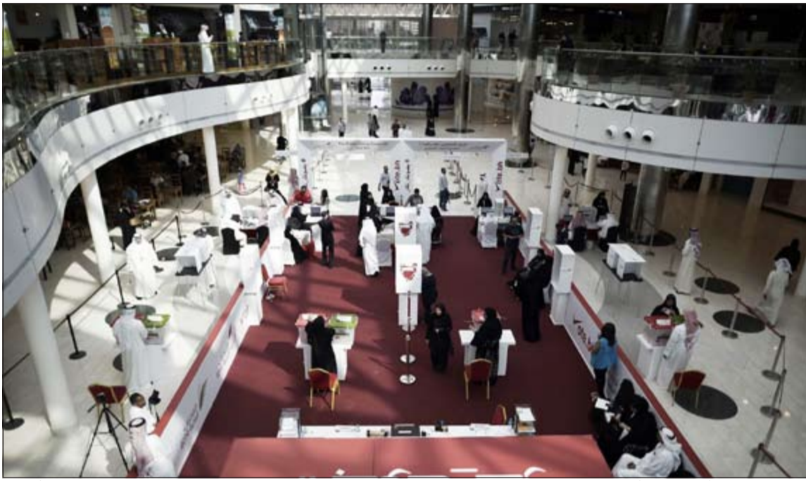
بحرينيون يبلون بأصواتهم في أحد مراكز الاقتراع أمس

وكان البوغيتين، قد أعلن كذلك شهدت الدائرة العاشرة بمحافظة الشمالية مناسفة إخوانية سلفية في جولة الإعادة بين كل من محمد