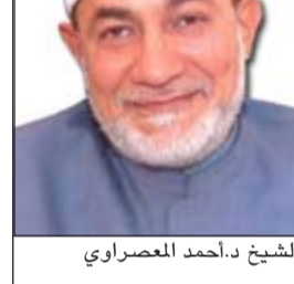
الشيخ د.أحمد المعصراوي

وذلك لتعميم الفائدة والاستفادة لكل شرائح وفئات الجمهور الكريم. وفي ختام البيان دعت إدارة الثقافة الإسلامية الجمهور الكريم إلى التواصل والتفاعل مع كل فعاليات الثقافية والدعوة من خلال المشاركة الإيجابية والتجاوب مع الأنشطة والبرامج الخاصة بها والتي يمكن الوقوف على آخر مستجداتها من خلال زيارة الموقع الرسمي على شبكة الانترنت: www.islam.gov.kw/thaqafa