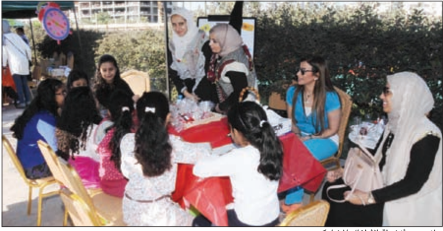
جانب من أنشطة الأطفال المشاركين