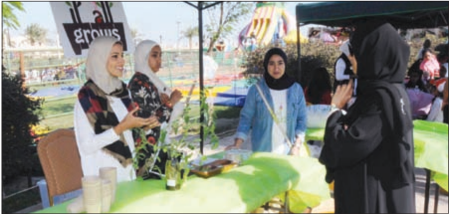
من المشاركات في المعرض