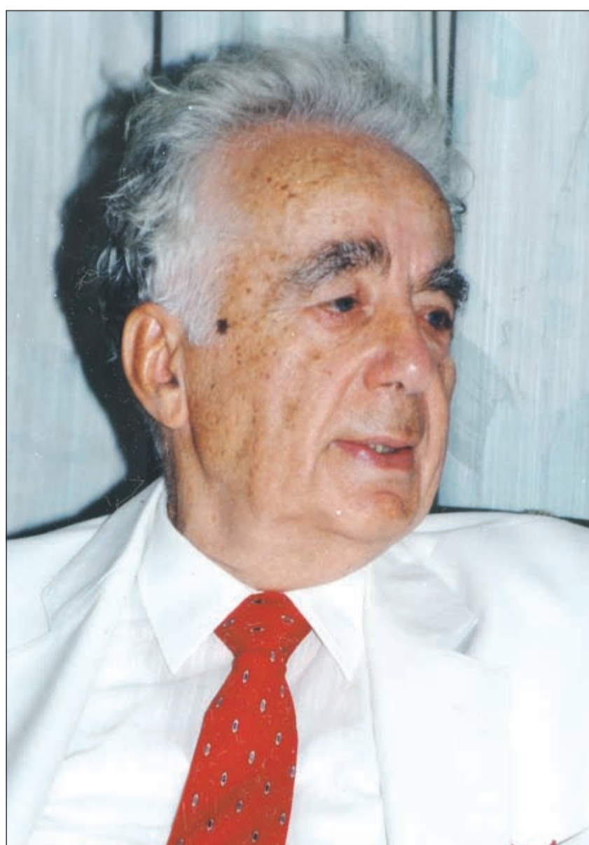
الراحل الشاعر سعيد عقل

وقد كتب النثر، ومن أعماله في هذا المجال «يوم النخبة» و«كأس لخم» و«لبنان ان حكي» الذي يتطرق إلى أمجاد لبنان بأسلوب قصصي. وفي المسرح وضع عقل خصوصا «قدموس»، في العام 1954 صدر له كتاب «مشكلة النخبة» الذي