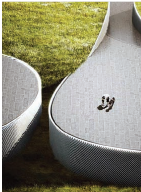
فاز المهندسون الدنماركيون ببارز الملعب لتصميم متحف موبيلي خاص بجسم الإنسان ويتكون الهيكل المترامي الأطراف من ثمانية منحنيات موصولة بمساحات العرض