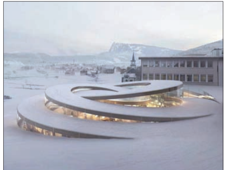
متحف غريب الشكل عبارة على هيكل ملفوف صغير ومجوف جزئيا وهو مخصص لصانع الساعات السويسري أوديمارس بيجو تم تصميمه من قبل المهندسين المعماريين الدنماركيين