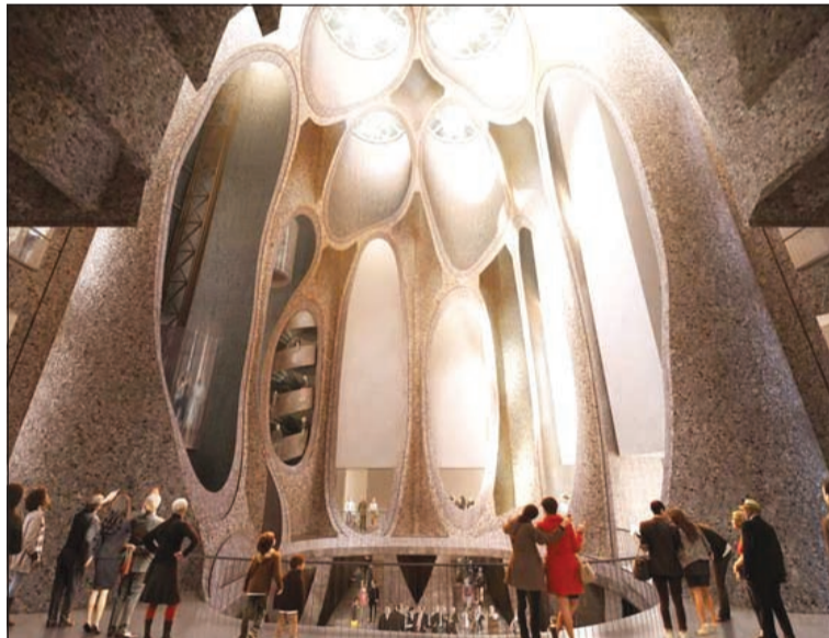
متحف في كيب تاون سيتم افتتاحه في عام 2016 وسيخصص للفن الأفريقي المعاصر من تصميم المهندس المعماري توماس ويتميز المتحف بنحو 42 أنبوبا ملموسة عمودية في وسطها