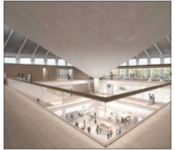
مدينة متكاملة مصممة على شكل متحف تنقلك الى مبنى معهد الكومنولث السابق على شارع Kensington High سيفتتح في عام 2016 وتم تصميم الديكورات الداخلية من قبل جون باوسن