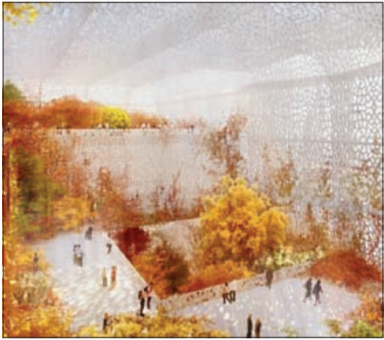
ستحظى الصين بافتتاح متحف في بكين للفن الوطني من تصميم جان نوفيل وسينفرد هذا المتحف بدمج مختلف السمات غير المتوقعة والعجيبة بما في ذلك حديقة داخلية ذات تصميم مبدع