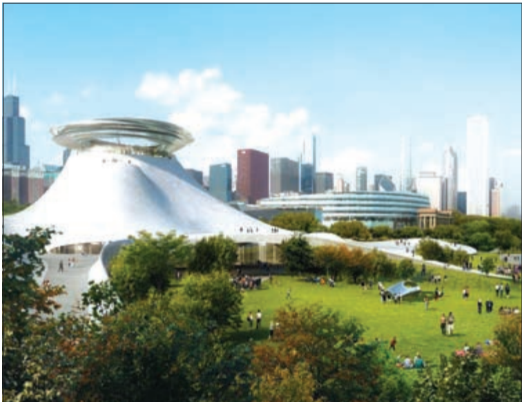
مدينة شيكاغو الأمريكية بصدد تشييد متحف جورج لوكاس قيمة بنائه نحو 300 مليون دولار وسيتم تخصيصه للفن السردي او النثري ولمفهوم القص وسيفتتح في عام 2019