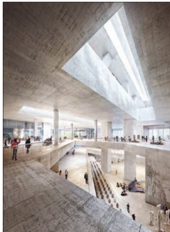
متحف في هونغ كونغ سيفتح أبوابه للزوار من مختلف بقاع العالم عام 2018 وتكمن ميزته في الأماكن الثقافية المختلفة التي سيحتويها