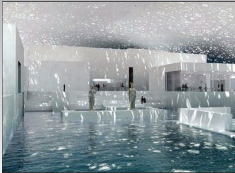
متحف مستوحى تصميمه من اللوفر موقعه في مدينة أبو ظبي وتحديدًا في جزيرة السعديات وقد صمم من قبل جان نوفيل وسيضم مجموعة "أثرى القروض" من متحف اللوفر في باريس وسوف تكون جزيرة السعديات وجهة مهمة عندما يتم الانتهاء من الأعمال في عام 2020