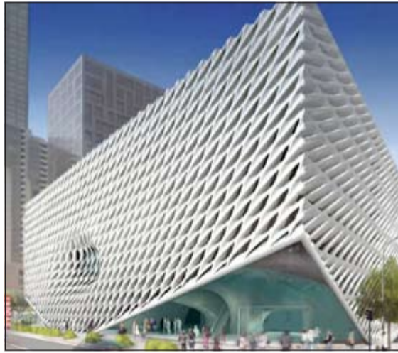
متحف لوس أنجليس الذي سيفتح في غراند أفنيو في عام 2015 فسيتحتوي على قاعات عرض واسعة تعكس الفن المعاصر وقد تم تمويله من قبل المتبرعين وإيلي وايديث وسيعرض المتحف أيضا أعمالا فنية من مجموعتهم الشخصية