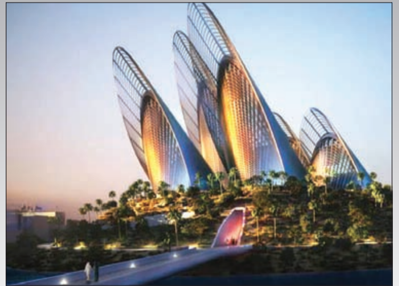
تم تصميم متحف زايد الوطني في جزيرة السعديات من تصميم نورمان فوستر وهو يقوينة رائعة و خلاصة سوف تجذب السياح في السنوات القادمة لتمتعهم بزيارة واحدة من عجائب المستقبل في العالم