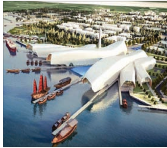
المتحف البحري الوطني تيانجين الصيني المقرر افتتاحه في عام 2015 سيحتوي على مناطق مختلفة في كل معرض وهو متكون من خمس قاعات عرض ومطل على البحر