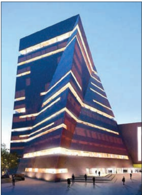
متحف يعكس بدائل المشهد الثقافي في لندن سيفتتح في عام 2016 وسيحتوي على أحداث درامية