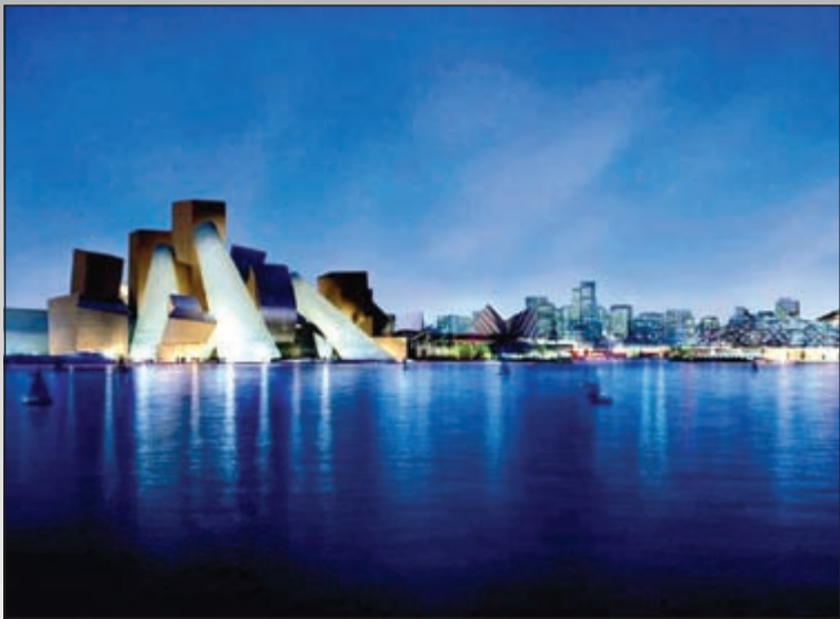
متحف متطور وضخم بصدد البناء حاليا في أبوظبي جزيرة السعديات وهو عبارة عن حي ثقافي جديد سيضم مجموعة من المتاحف الاستثنائية وهو من تصميم فرانك جيري. يعد أحد المتاحف المتطورة في العالم الثقافي الأكثر طموحا وسيفتتح أبوابه بالكامل لزواره بحلول 2020

مجموعة من المتاحف العالمية الغريبة في تصميمها والباهظة في تشييدها ستفتتح أبوابها لزوارها من مختلف بقاع العالم في السنوات القادمة لتتحول الى مزارات سياحية عالمية لما تتميز به من ابداع هندسي وصلات لعرض كل جديد في مختلف القطاعات لتصبح معالم سياحية عالمية. ومن عجائب الدنيا في المستقبل وذلك وفق تقرير نشرته صحيفة ذي تلغراف. وتضم قائمة المتاحف متحفين سيثيدان في العالم العربي وتحديدًا في أبوظبي و متاحف في كل من أمريكا والصين وسويسرا. وفيما يلي عرض لصور ماكيت تصميم المتاحف: