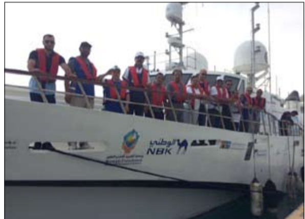
قارب «رحلة الأمل» مغادرا مملكة البحرين الى الدمام

المناامة - كونا: غادر قارب «رحلة الأمل» أمس مملكة البحرين متوجها إلى الدمام قبل عودته إلى الكويت في رحلة استغرقت ما يقارب 7 أشهر للفت انتباه العالم إلى فئة ذوي الاحتياجات الخاصة (متلازمة الدوان). وكان القارب الذي وصل إلى مملكة البحرين الإثنين الماضي أمضى عدة أيام قام خلالها قائد الأسطول الخامس الأمريكي الأدميرال جون ميللر بتقليد طاقم الرحلة من ذوي الاحتياجات الخاصة أنواط الشجاعة العسكرية تقديرا لقيامهم بالرحلة الطويلة من أجل حمل رسالتهم إلى مختلف دول العالم.