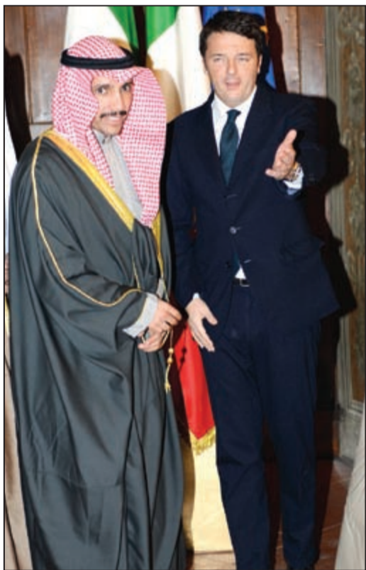
رئيس مجلس الأمة مرزوق الغانم مع رئيس الوزراء الإيطالي ماتينو رينتسي

الغانم: رئيس وزراء إيطاليا أكد أهمية العلاقة مع الكويت واهتمام من الجانب الإيطالي بتوثيق وتطوير العلاقات المشتركة