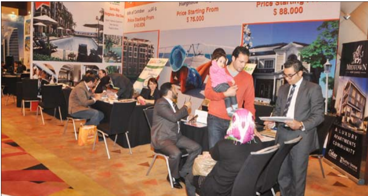
جناح إحدى الشركات المشاركة في المعرض