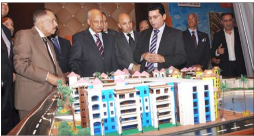
السفير المصري ومجدي الهواري وم. يونس عطية أمام مجسم منتج مارينا سيتي في بورت غالب