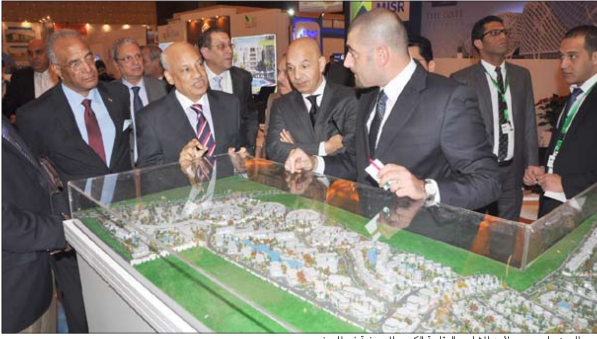
ويطلعون على مجسم لأحد المشاريع العقارية الكبرى المعروضة في المعرض