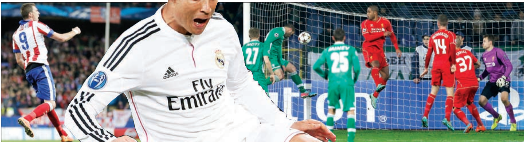
ماندزوكيتش أهدع وامتع