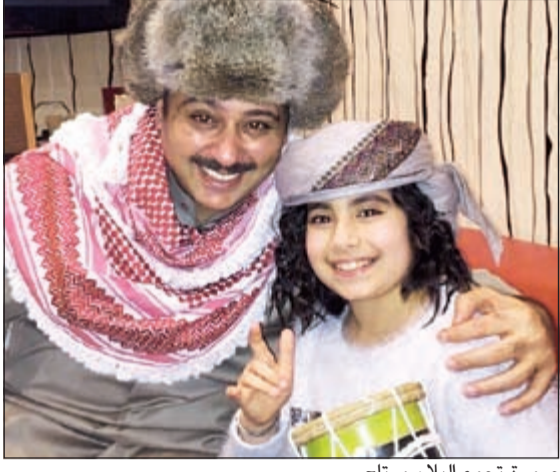
صورة تجمع البلام ورتاج