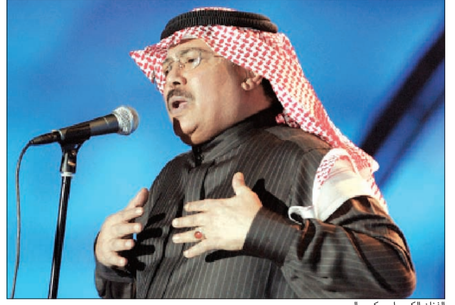
الفنان الكبير أبو بكر سالم

وأشار سالم، في تصريحات له، إلى أنه اعتاد على تقبل مثل هذه الأكاذيب، الأمر الذي جعله لا يعيرها اهتمامه رغم ما تسببه من قلق للأهل والأصدقاء خاصة البعيدين منهم.