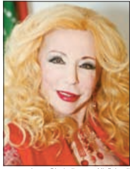
الفنانة الكبيرة الراحلة صباح