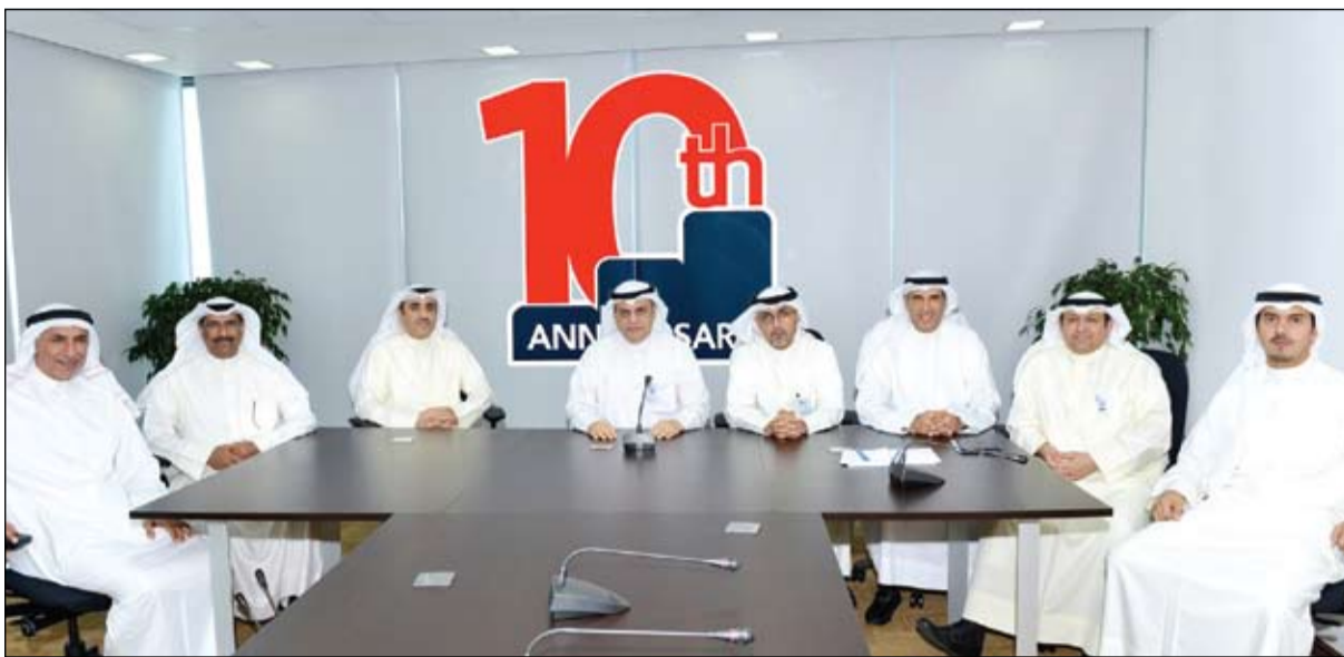
الإدارة التنفيذية العليا للبنك

يمثل عام 2005 الانطلاقة الفعلية للعمليات التشغيلية للبنك، حيث كانت البداية بعدد محدود من الموظفين بدأوا العمل