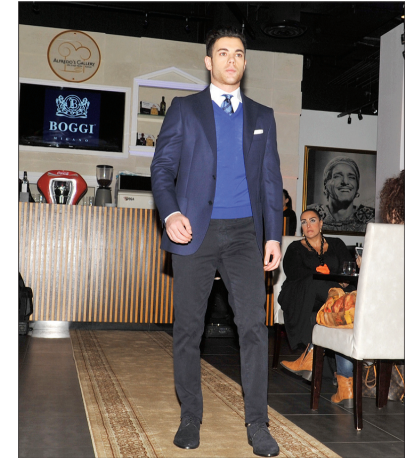
الوان داكنة وطابع انيق