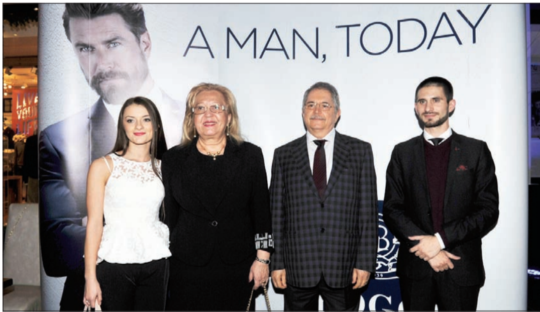
السيناتور الروماني وجرمه حضرا المناسبة

تستعرض تشكيلتها الجديدة لموسمي الخريف والشتاء في مطعم ألفريدوز جاليري بالأقنيوز