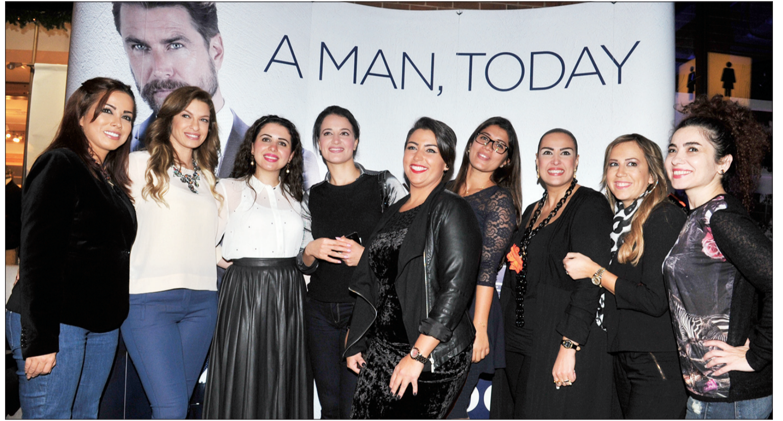
حضور إعلامي اثناء الحفل