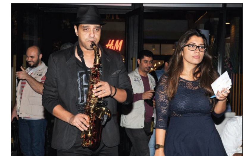
العشاء على انغام الساكسفون الايطالية الساحرة