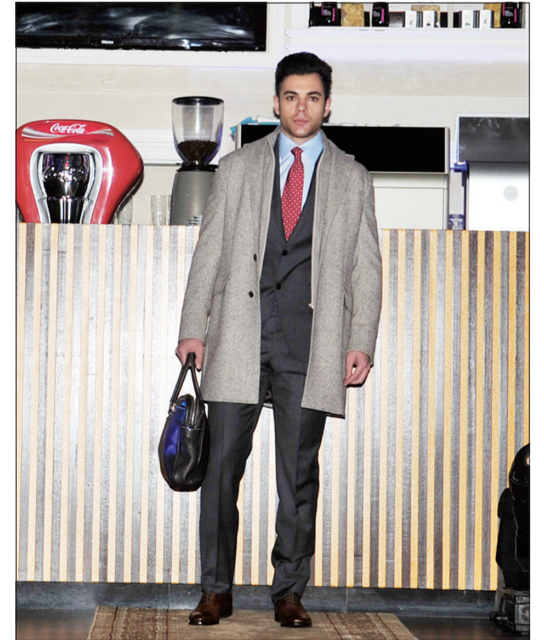
أزياء الشتاء وعودة الملابس غير المنسقة بقوة إلى ساحة الموضة