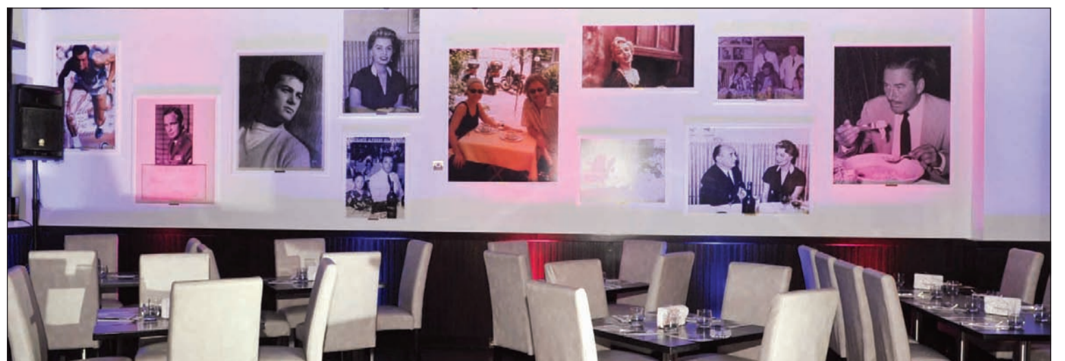
معلم الفريديوز جاليري في الأفتنيوز وأجواء مميزة لاستقبال الحفل