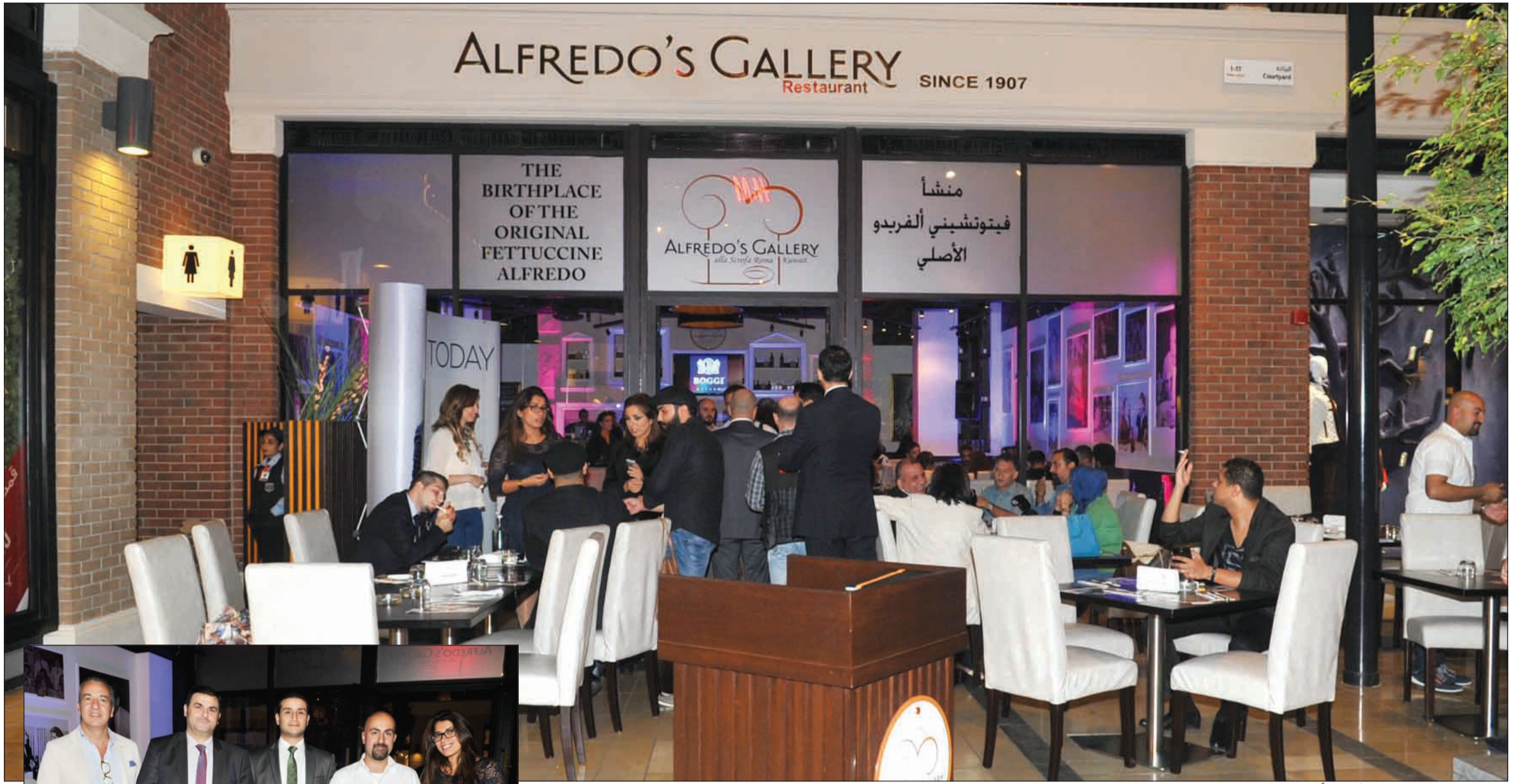
معلم الفريديوز جاليري في الأفتنيوز وفر أجواء مناسبة لاستقبال الحفل وسط الانغام الايطالية