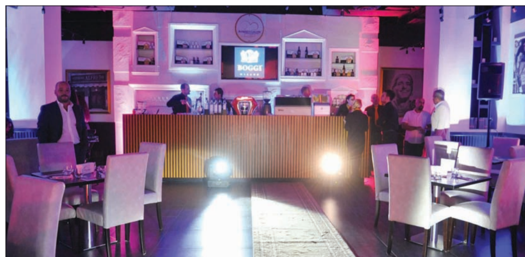
ديكورات المطعم تتميز بالرقي والفاخرة