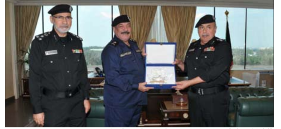
اللواء العلي يسلم الفريق القهد الدرع بحضور العميد عبدالرحمن العبدالله

استقبل وكيل وزارة الداخلية الفريق سليمان فهد القهد في مكتبه بمقر وزارة الداخلية صباح أمس وكيل وزارة الداخلية المساعد لشؤون الأمن العام اللواء عبدالفتاح العلي، وذلك بحضور مدير إدارة الشرطة المجتمعية العميد عبدالرحمن العبدالله. وتوجه اللواء العلي للفريق القهد بالشكر والتقدير لجهوده في دعم مشاركة وزارة الداخلية بالاحتفال ليوم التسامح العالمي ومساهمته في ترسيخ معاني التسامح وتكريس ثقافة الحوار والوعي بالقيم الإنسانية وتعزيز التواصل الاجتماعي في إطار اهتمامات وزارة الداخلية بنشر قيم التسامح ونيل العنف ومراعاة حقوق الإنسان بين أفراد المجتمع. وأهدى وكيل وزارة الداخلية المساعد لشؤون الأمن العام اللواء عبدالفتاح العلي درعا تذكارية لوكيل وزارة الداخلية الفريق سليمان فهد القهد، بمناسبة رعايته لاحتفالات وزارة الداخلية بيوم التسامح العالمي.