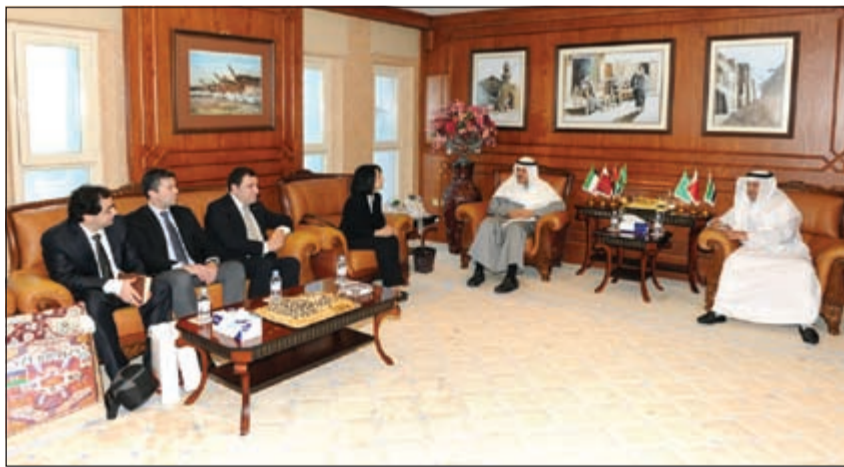
الشيخ سلمان الحمود أثناء استقباله لثانية رئيس مركز الدراسات الاستراتيجية التابع لرئيس أذربيجان قولشان باشييفا

التعاون مع الكويت في شتى المجالات الاقتصادية والتعليمية وذلك عن طريق عقد مؤتمرات وحلقات نقاشية واعداد بحوث ودراسات تعزز مستوى التعاون بين البلدين، لافتة الى ما تتمتع به أذربيجان من علاقات متميزة مع دول الخليج.