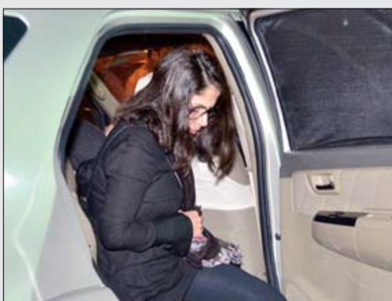
منى زكي في أول ظهور لها بعد عودتها من أميركا

يعطيهما الصبر، وتمنت لو كان باستطاعتها دخول مصر لتقوم بواجب العزاء معها. وكان شقيق أصالة أيهم، البالغ من العمر اثنين وأربعين عاماً، قد توفي بسكتة قلبية مفاجئة أثناء وجوده في مصر، حيث يبقى لفترات طويلة في القاهرة وذلك بعدما اشترى أحد المطاعم الكبرى في العاصمة ويشرف عليه بنفسه، وأثناء دخوله إلى المطعم فوجئ بتعب شديد، ثم سقط وأغمى عليه لينقل إلى مستشفى السلام الدولي، حيث لفظ أنفاسه الأخيرة هناك، وذهبت أصالة وشقيقها الأصغر وفقاً لزوجها طارق العريان على الفور إلى المستشفى لاستقبال خبر الوفاة.