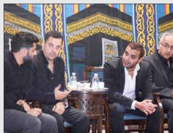
طارق العريان في استقبال المميزين

غادة رجب، رامي صبري، لطيفة، دنيا عبدالعزيز والإعلامية بسمة وهبي، هشام عباس، محمد رحيم، لبلبة، رامي وحيد، مصمم الأزياء هاني البحيري، أعضاء فريق بلاك تيم،